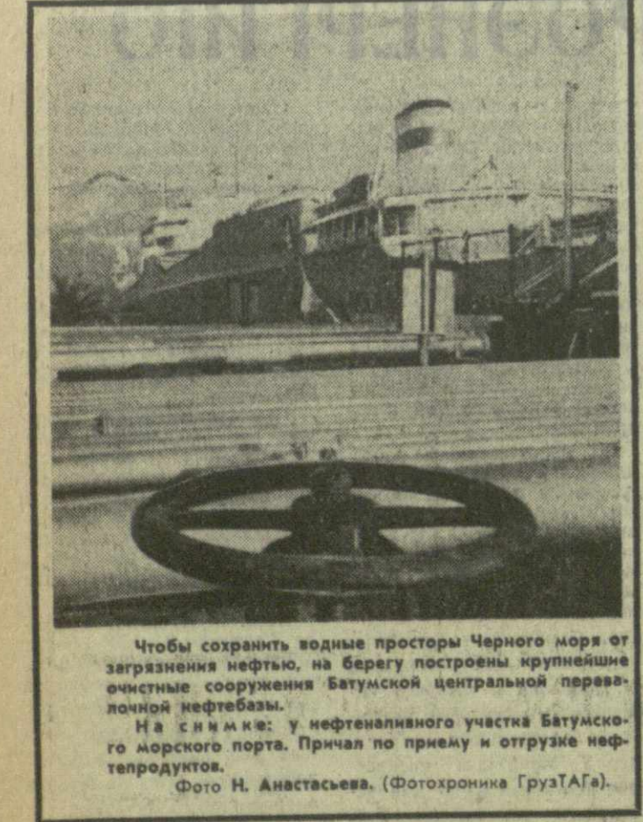
Чтобы сохранить водные просторы Черного моря от загрязнения нефтью, на берегу построены крупнейшие очистные сооружения Батумской центральной переработочной нефтебазы. На снимке: у нефтеналивного участка Батумского морского порта. Причал по приему и отгрузке нефтепродуктов.