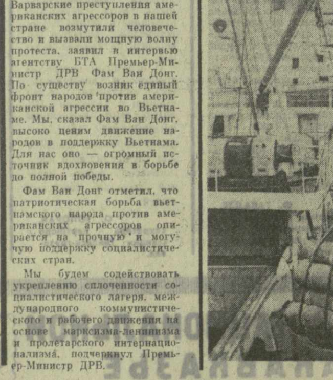
На снимке: разгрузка советского теплохода «Мга». Советские рыболовецкие суда, ведущие промысел в Атлантике, и теплоходы — частые гости в порту.