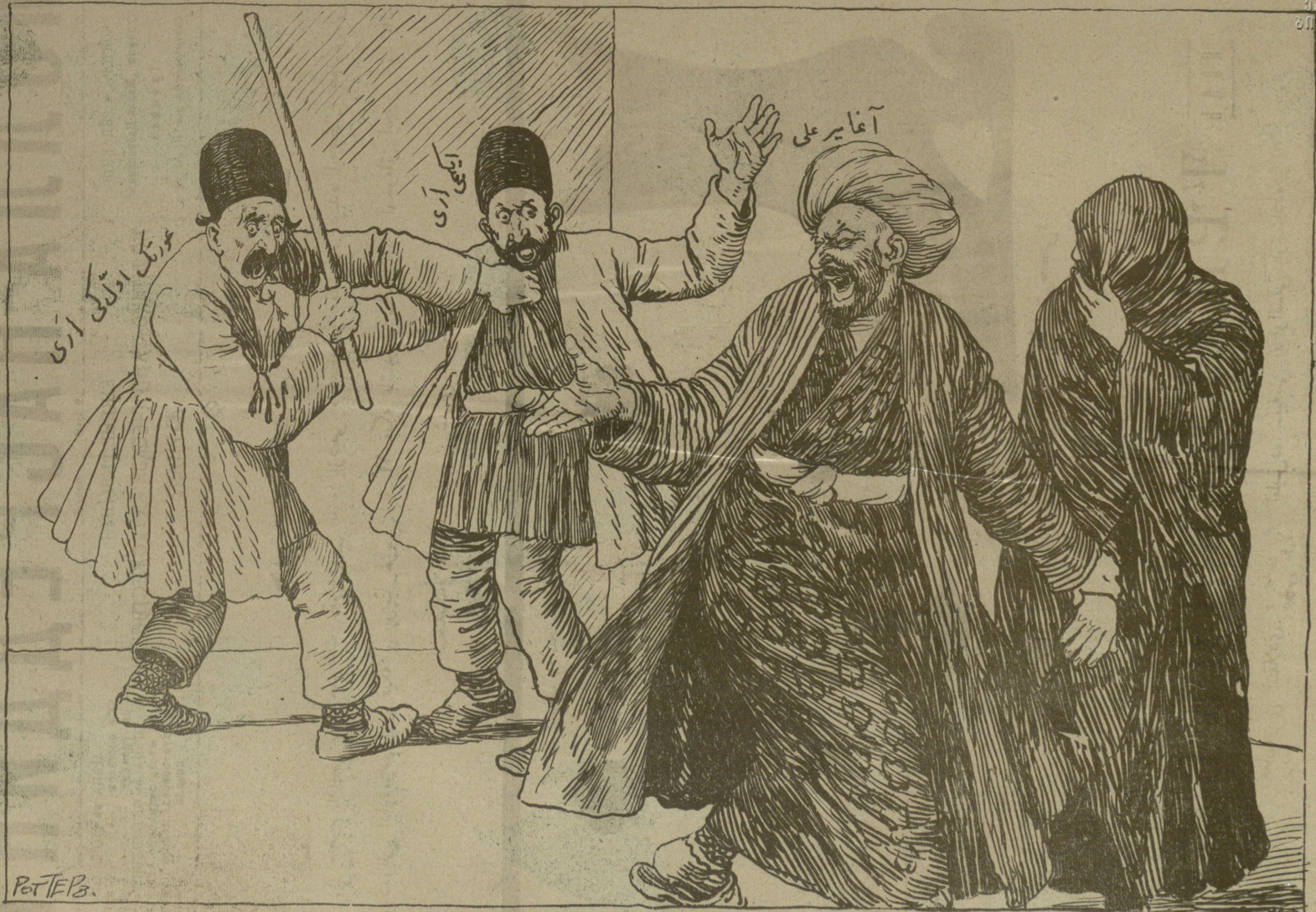
Նազե Եւրոպական Ագայ Եւրոպական : Եւրոպական օրինակ : Եւրոպական օրինակ և Եւրոպական օրինակ