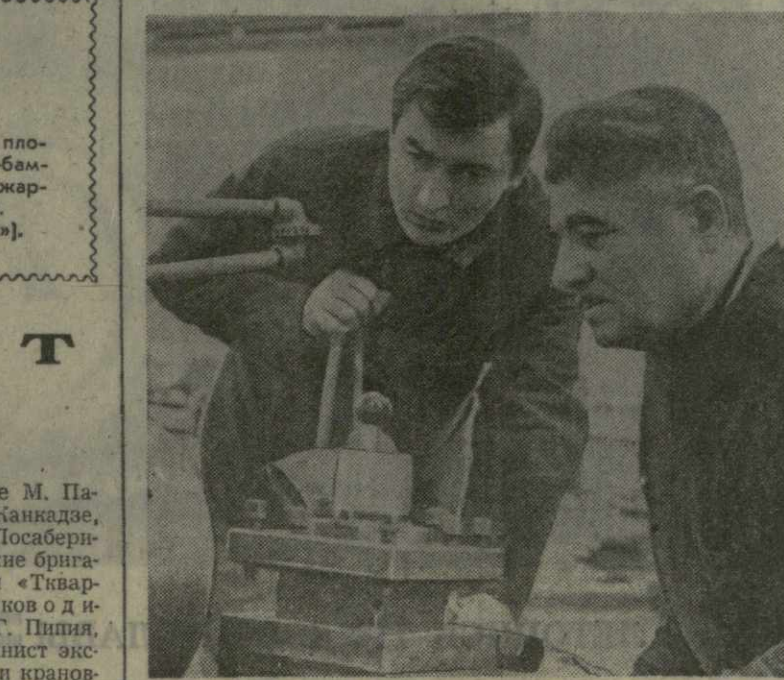
Коллектив Цхинвальского автобусремонтного завода успешно завершил годовое производственное задание. После капитального ремонта выпущены сверх плана десять автобусов.

Славными трудовыми делами завершили четвертый год пятилетки грузинские шахтостроители. Соревнуясь за достойную встречу 100-летия со дня рождения В. И. Ленина, коллектив треста № 7 «Грузшахтострой» досрочно, к 20 декабря выполнил годовой план строительно-монтажных работ. Лучших показателей по росту производительности труда добились шахтостроители Ткибули, Ткварчели, Чиагура, работники управления «Грузшахтострой».