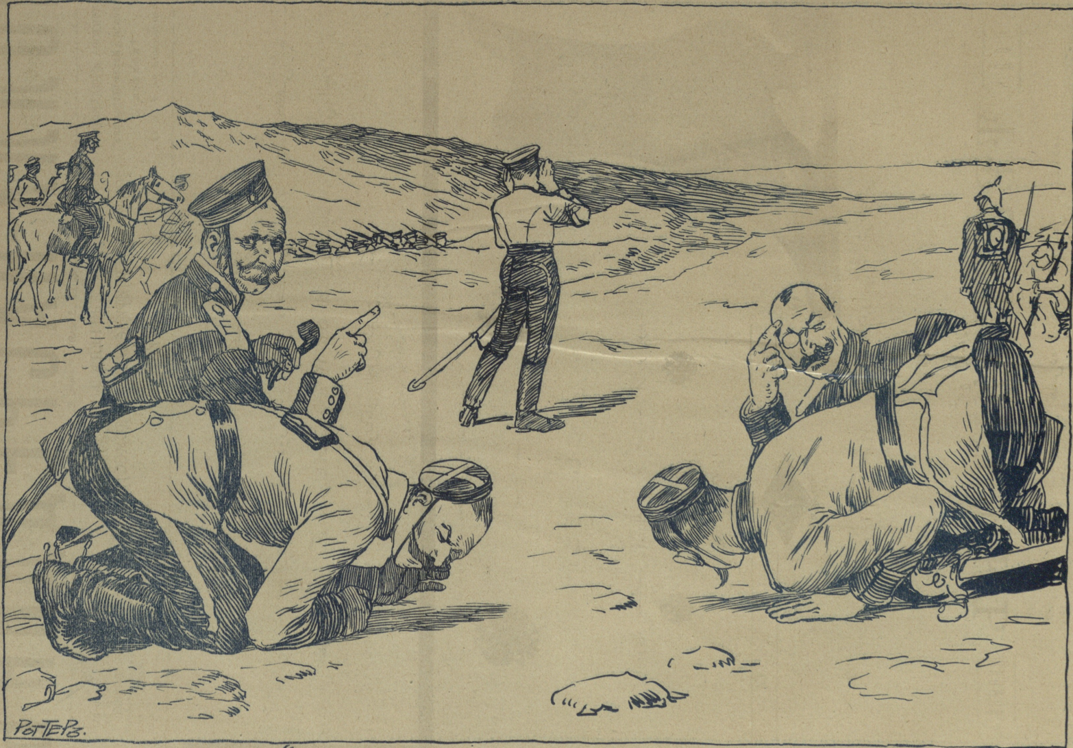
მე ვარ თოლაგინი ბრე დირირმ - თარაფ თორაფ დონ სოაი ბრსს კლმირ