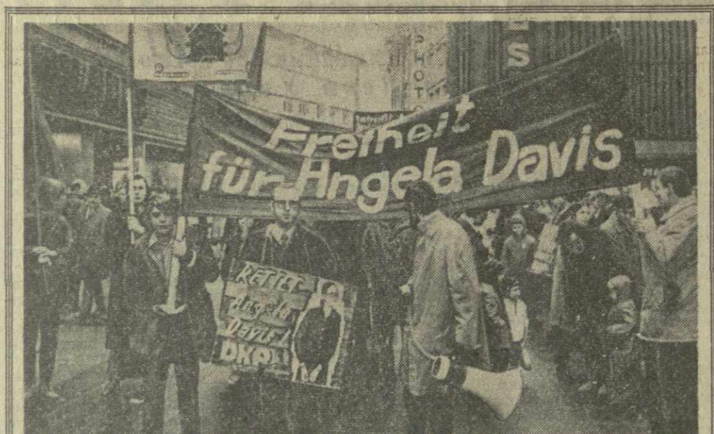
В ГОРОДЕ ДЮССЕЛЬДОРФЕ (Западная Германия) состоялась многотысячная демонстрация в защиту американской коммунистки Анджелы Дэвис. Демонстрация была организована Германской коммунистической партией. В руках у демонстрантов несут плакаты с надписями: «Свободу Анджеле Дэвис», «Слава Анджеле Дэвис».

Прошлого этого адвоката разоблачала газета «Норес Дойчланд» (ГДР), опубликовавшая