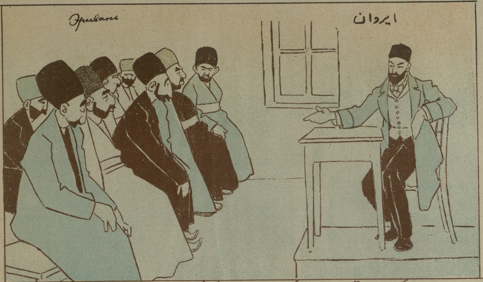
شهر مکتبندہ معلم میرزا محمد ولی ننگ لیتقیاسی (ایکجی گوی ده قار آبارینی دانیر)