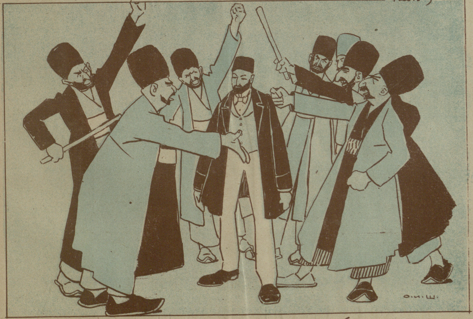
Возмездие за лекцию