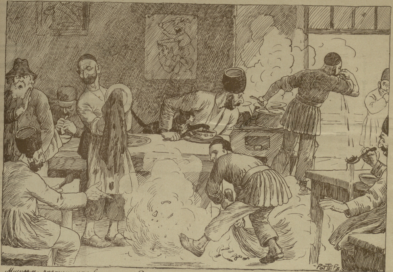
Мусулман. ростомничаи ба ҷороницаи Дарарураи