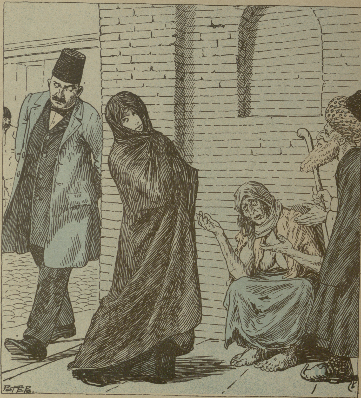
Литог. С. Быхова

№ 49. Цѣна 12 к. МОЛЛА НАСРЕДДИНЪ ۱۵۹ قیمتى ۱۲ قېك