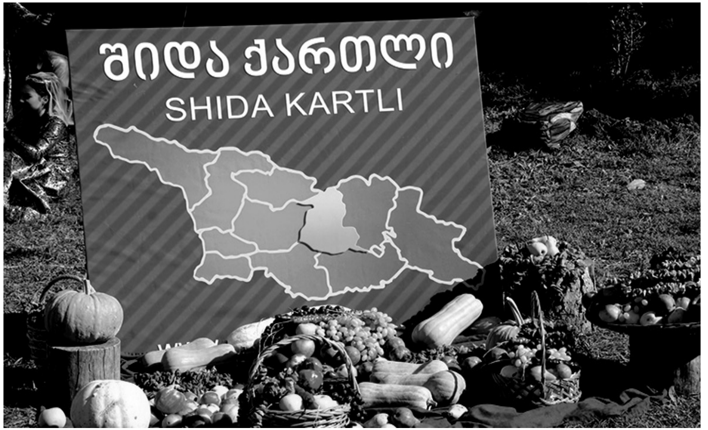
ენყოფა ფოლკლორული კონცერტები, თეატრალური წარმოდგენები, ადგილობრივი სამზარეულოს, ღვინის კუთხეებისა და ქართული ტრადიციული რეწვის მასტერკლასები.

აღსანიშნავია, რომ თბილისის ეთნოგრაფიულ მუზეუმში უკვე მესამე წელია საქართველოს სხვადასხვა კუთხეების წარმომადგენლები ადგილზე მისულ სტუმრებს მათთვის დამახასიათებელ ტრადიციებსა და კულტურას აცნობენ.