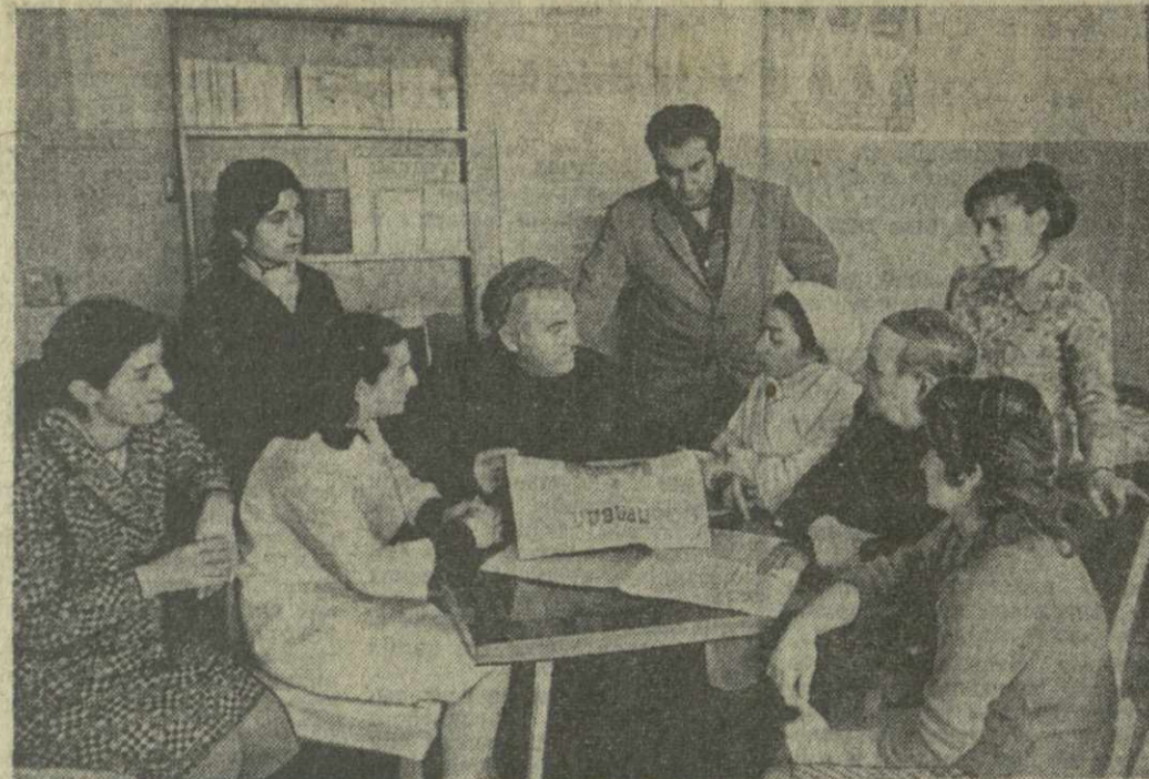
Доклад товарища Л. И. Брежнева на совместном торжественном заседании ЦК КПСС, Верховного Совета СССР и Верховного Совета РСФСР, посвященном 50-летию образования СССР, Обращение ЦК КПСС, Президиума Верховного Совета СССР и Совета Министров СССР к советскому народу, к трудящимся всех национальностей Союза Советских Социалистических Республик стали предметом широкого обсуждения в коллективах промышленных предприятий, колхозов и совхозов, научных организаций республики.