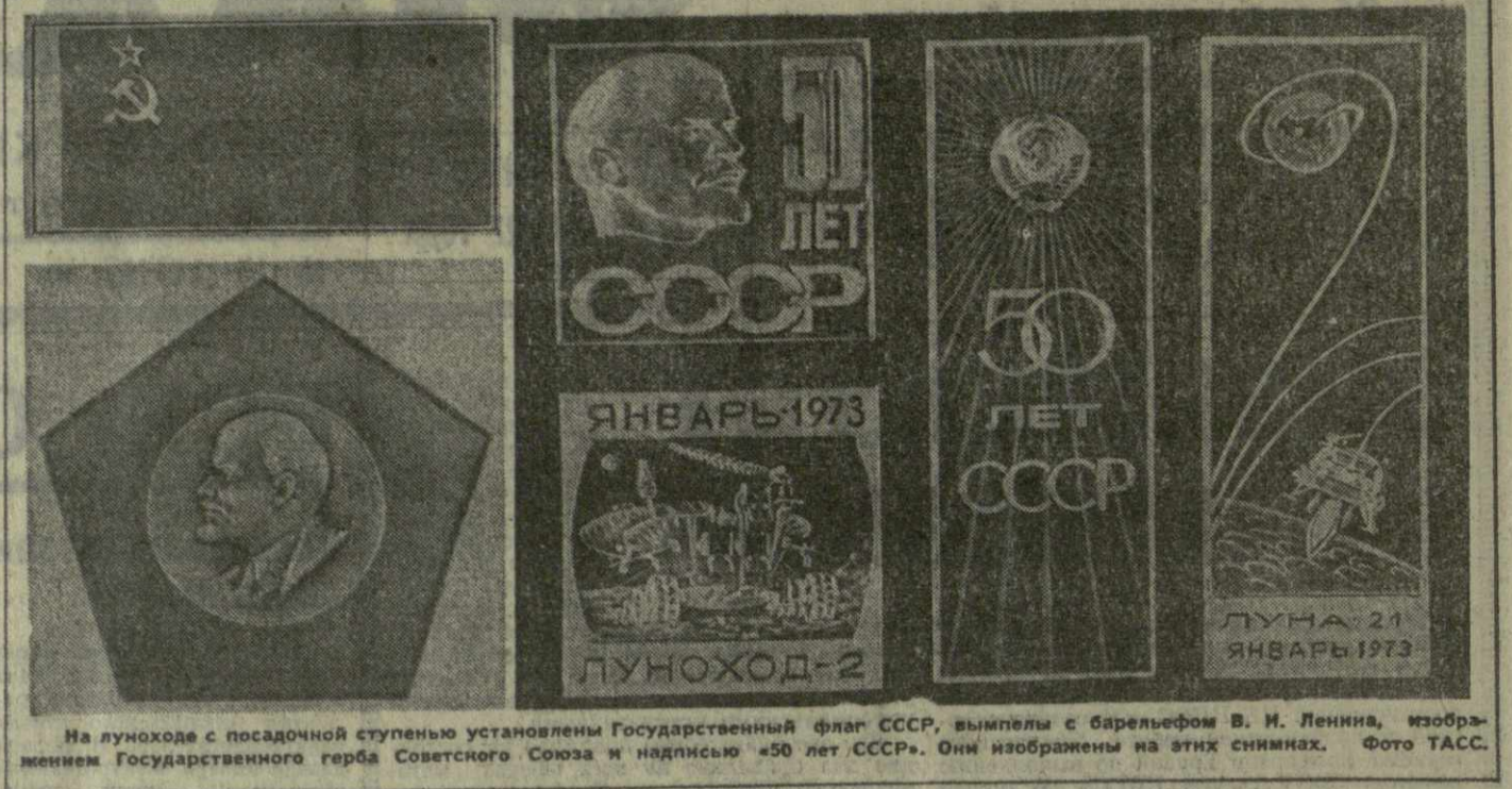
На луноходе с посадочной ступенью установлены Государственный флаг СССР, вымпелы с барельефом В. И. Ленина, изображением Государственного герба Советского Союза и надписью «50 лет СССР». Они изображены на этих снимках.

Д. ДМИТРИЕВ. (Спец. корр. ТАСС). Центр дальней космической связи.