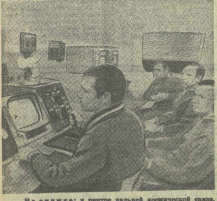
На снимке: в центре дальней космической связи. Экипаж «Лунохода-2» за работой. (Принято по фототелеграфу Грузин-ФОРМА).