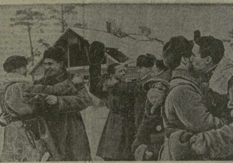
Ленинградская область. От берегов ильменской речки Навля до верховьев Невы — всего несколько километров и шесть дней кропотливой работы, не считая сражений, предпринятых победоносной армией 1943 года. Именно здесь 30 лет тому назад началось наступление войск Ленинградского и Волховского фронтов, цель которого была — прорыв блокады города Ленинграда. Тщательно подготовленная операция была успешно завершена утром 18 января. Войска двух фронтов соединились, и вражеское кольцо вокруг Ленинграда было прорвано. На снимке: 1943 год. Блокада Ленинграда прорвана. Встреча бойцов и командиров Волховского и Ленинградского фронтов.

Героическое сопротивление Ленинграда стало во всем мире символом мужества.