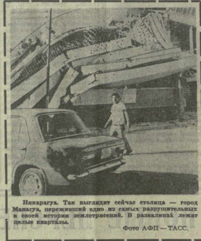
Никарагуа. Так выглядит сейчас столица — город Манагуа, переживший одно из самых разрушительных в своей истории землетрясений. В развалинах лежат целые кварталы.

НЬЮ-ЙОРК, 18 января. (ТАСС). Объявила забастовку 3 400 рабочих завода, выпускающего телевизоры в Сирин-