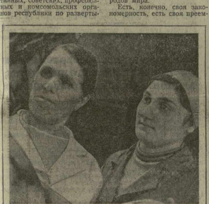
Кутаисская швейная фабрика имени В. И. Ленина выпускает продукцию высокого качества, которая отгружается более чем в 80 городов Советского Союза.

правленные на обеспечение дальнейшего подъема экономики нашей страны, намечены конкретные задачи в этой области, главная из которых состоит в том, чтобы не только успешно справиться с плановыми заданиями на 1973 год, но и значительно их превзойти, создать необходимый задел на последующие годы.