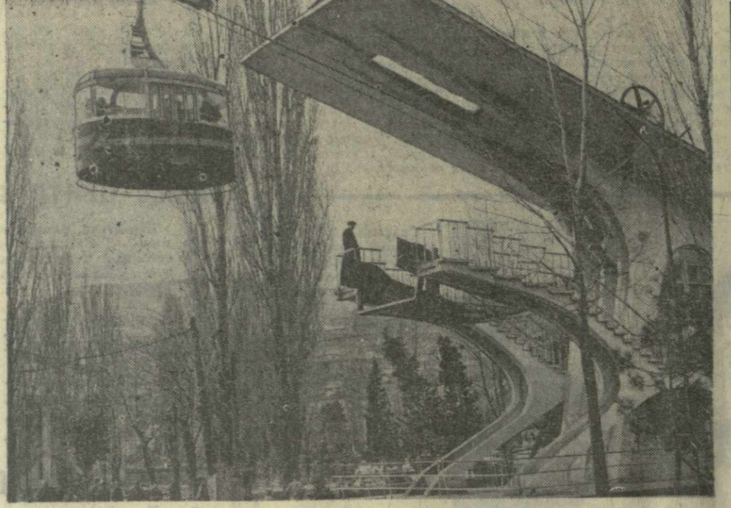
Чинатура сегодня. На снимке: станция канатной дороги.