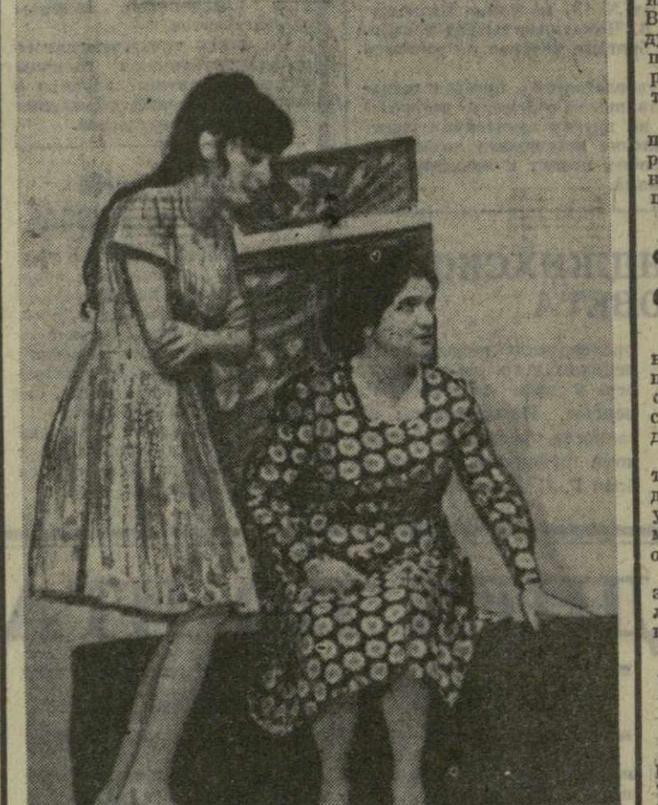
На сцене Тбилисского Дома актера проходит республиканский фестиваль самодельных театральных коллективов профессионалов Грузии. Тбилисские зрители уже познакомились с искусством самодельных артистов из Самтредиа, Ткварчели, Чинатура, Тбилиси, Рустави и Ткибули. На снимке: сцена из пьесы К. Буачидзе «Деревенская девушка», в постановке Абхазского народного театра Дома культуры шахтеров города Ткварчели.