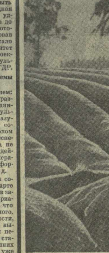
ЗИМА НА ЧАЙНЫХ ПЛАНТИНАХ

Редация решила создать свои посты на этих предприятных и взять под контроль выполнение всех спартакиадных заказов. Крупнейшие составление предстоящей зимы должны быть проведены в Бакуриани на самом высоком уровне.