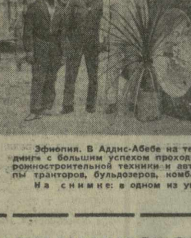
Эфиопия. В Аддис-Абебе на территории советско-эфиопского общества «ЭФСО Трейдинг» с большим успехом проходила выставка советской сельскохозяйственной и автомобильной техники. На ней были представлены различные типы тракторов, бульдозеров, комбайнов, дорожных катков, компрессоров. На снимке: в одном из уголков выставки.

тическую Республику Вьетнам, чтобы обсудить с правительством ДРВ вопросы о послевоенных отношениях между двумя странами и другие вопросы интересующие обе стороны. Киссинджер посетит также КНР.