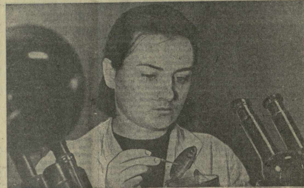
Коллектив Грузинского отделения Всесоюзного научно-исследовательского института рыболовства и океанографии в Батуми проводит плодотворную работу по акклиматизации новых пород рыб, изучению водных ресурсов, выработке технологии промышленного рыболовства, занят и решением вопросов сохранения чистоты водных бассейнов.

фандров либо линзы сами по себе рассеивают свет. Кроме того, они могут поглотить незаметным слоем пыли. Все это искажает результаты измерений. Наш безэлектронный телескоп лишен этих недостатков. С практической точки зрения такие исследования помогут выяснить, насколько «удаленнее» при взгляде с Земли небесные тела, чем с Луны. — Очевидно, установленный на Луне телескоп окажется более дальновидным, чем наземный инструмент, поскольку на Луне нет атмосферы? — Совершенно верно. Проводимые астрофотометром Лунохода исследования помогут выяснить, насколько детально созданные на Луне астрономической обсерватории. — Какие еще задачи вы ставите перед проводимыми исследованиями? — Мы хотим исследовать зодиакальный свет (рассеянное свечение, наблюдаемое на фоне ночного неба в обла-