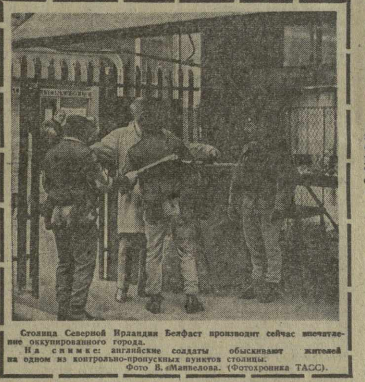
Строится Северная Ирландия Белфаст производит сейчас впечатляющие оккупированного города. На снимке: английские солдаты обстреливают жителей на одном из контролируемых пунктов столицы.