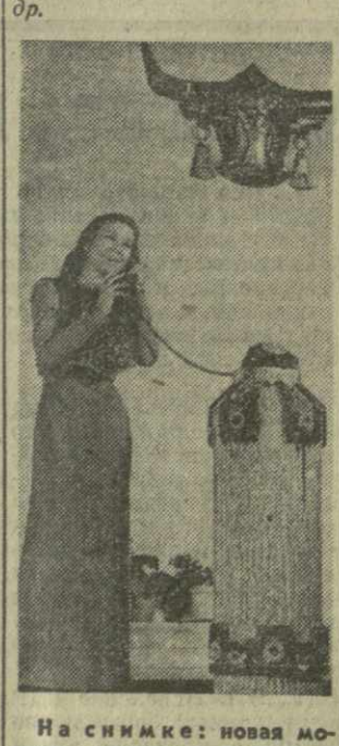
На снимке: новая модель длинного вечернего платья.

Боевому содружеству воинов-грузин с воинами других национальностей посвящена монография подполковника