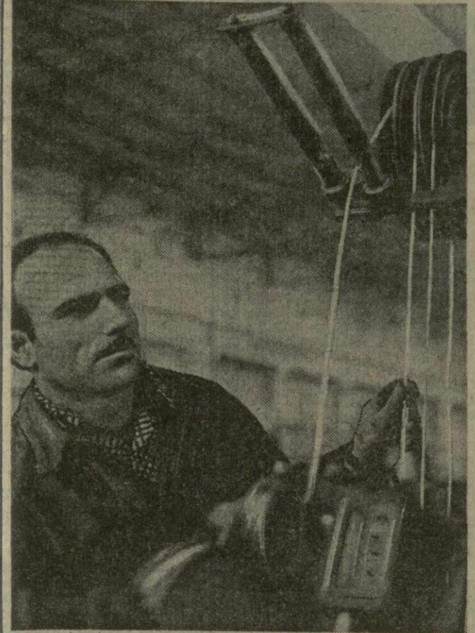
По ударному трудится в третьем, решающем году девятый пятилетки коллектив лезтафонского завода «Грузнабель».