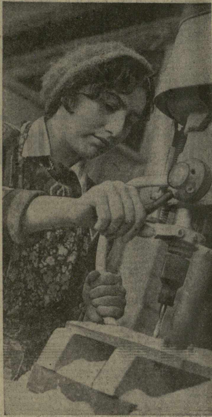
Отлично начали третий год пятилетия труженики Близнецкой фабрики плутовой мебели.