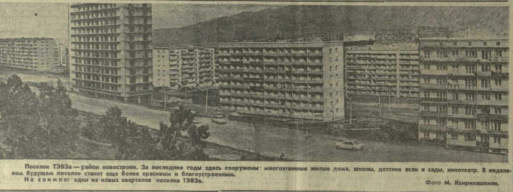
Поселок ТЭВЗ — район новостроек. За последние годы здесь сооружены многоэтажные жилые дома, школы, детские ясли и сады, кинотеатр. В недалеком будущем поселок станет еще более красивым и благоустроенным. На снимке: один из новых кварталов поселка ТЭВЗ.