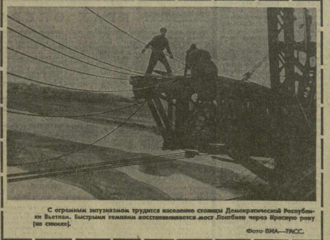
С огромным энтузиазмом трудятся население столицы Демократической Республики Вьетнам. Быстрыми темпами восстанавливается мост Лонгбьен через Красную реку (во символе).

Опасаясь новых случаев мародерства, израильское военное командование отрядило на охрану сбитого самолета специальное подразделение.