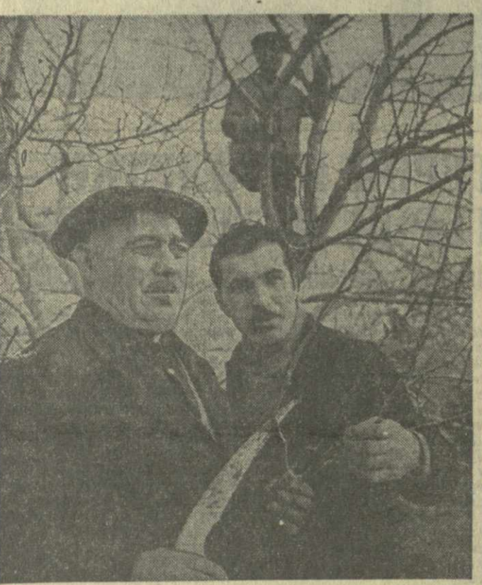
Высокими урожаями ароматных яблок славятся плодовые сады колхоза «Часки врозь» села Павли Горийского района, занимающие 450 гектаров. Если в минувшем году с каждого из 90 плодородных гектаров было получено по 67 центнеров яблок при плане 55 центнеров, то ударный год пятилетки плодовые сады обязаны отметить еще более высоким урожаем. Они рассчитывают получить в среднем с гектара по 70 центнеров плодов.