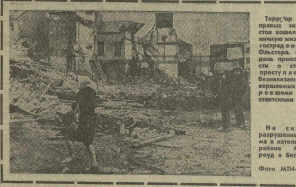
Террор ультраправых экстремистов вошел в будничную жизнь многоэтажного Олстера. Каждый день приносит вести о страшных преступлениях, безнаказанно совершаемых озерными протестантскими ультра. На снимке: разрушенные дома в католическом районе Фоллс-роуд в Белфасте.

БЕЛГРАД, 30 марта. (ТАСС). Президент СФРЮ председатель СКЮ И. Броз Тито посетил машиностроительный завод «Иво Лола Рибар» под Белградом. На встрече с коллективом предприятия он выступил с речью. Для решения имеющихся в югославском обществе проблем, сказал Тито, «мы прежде всего должны мобилизовать Союз коммунистов. Лишь Союз коммунистов является идейно-политической организацией, способной решить самые важные и трудные проблемы». Одним из важнейших вопросов Тито назвал идеологическое воспитание и борьбу с национализмом и либерализмом. Он подчеркнул также необходимость усиления борьбы с коррупцией и нарушениями финансовой дисциплины. Главная причина невооруженных явлений в обществе заключалась в том, отметил он, что «Союз ком-