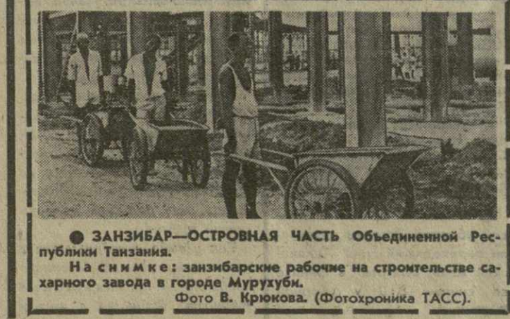
ЗАНЗИБАР—ОСТРОВНАЯ ЧАСТЬ Объединенной Республики Танзаниа. На снимке: занзибарские рабочие на строительстве сахарного завода в городе Мурукуби.

А В результате сильного землетрясения полностью разрушился жилой дом в городе Цициниати (штат Огайо). 7 человек погибли и 25 получили тяжелые ранения. Ударной волной повреждены соседние дома. Как полагают, причина в ней взрыва явилась утечка газа. (ТАСС).