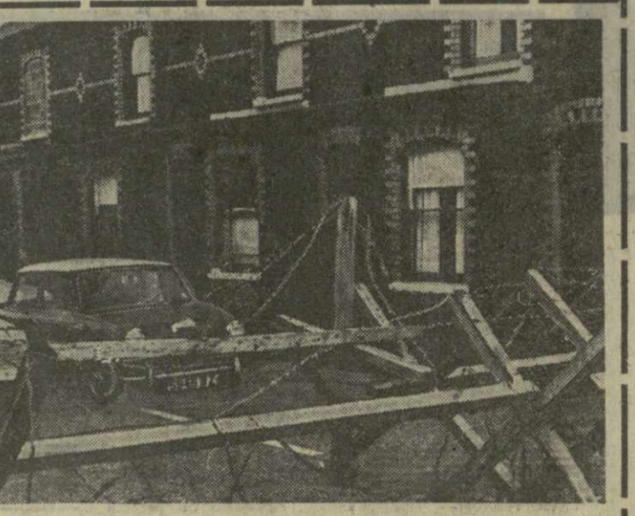
Многогарадные Ольстер напоминает в эти дни оккупированную страну. Улицы многих городов заняты английскими солдатами, перерезаны проволоканы заграждениями, на стадионах стоят танки, в школах устроены казармы. В католических кварталах продолжают греметь выстрелы и раздаваться взрывы бомб.

КОПЕНГАГЕН, 10 апреля. (ТАСС). Показом кинофильма «Белое солнце пустыни» здесь началась Неделя советского фильма. Она организована Датским киноинститутом и в ее составлении участвуют представители программы культурного сотрудничества между СССР и Данией. Датским зрителям будут показаны фильмы «Лебединое озеро», «Дядя Ва-