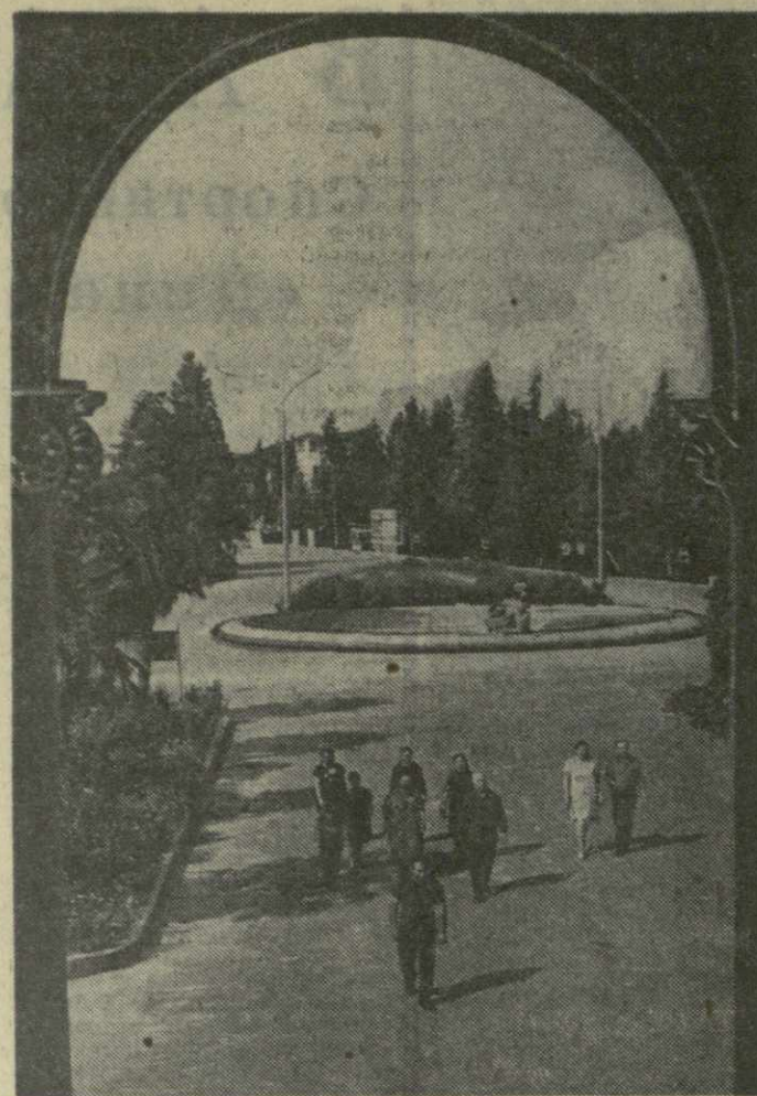
На снимке: один из уголков Ингриского ордена Ленина чайного совхоза Зугдидского района.

Дипломом первой степени был награжден грузинский режиссер, народный артист республики Г. Лордкипанидзе за постановку в Московском театре юного зрителя пьесы Н. Думбадзе и Г. Лордкипанидзе «Я, бабушка, Илик и Илларион».