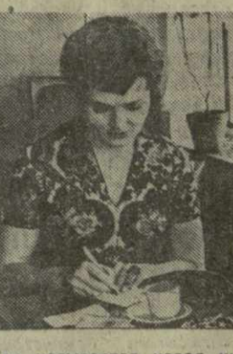
Так называется новая кинокартина производства киностудии «Мосфильм», которая скоро выйдет на экраны кинотеатров Тбилиси. Режиссер-постановщик — выпускник высших режиссерских курсов при «Мосфильме» и парижского института кинематографии Манос Захарян.

Новый фильм рассказывает о любви советской журналистки и героя греческого Сопротивления. Роли исполняют: Л. Чурсина, В. Скомооровский, Я. Мелдерис, Б. Иванов, Г. Совчик и другие.