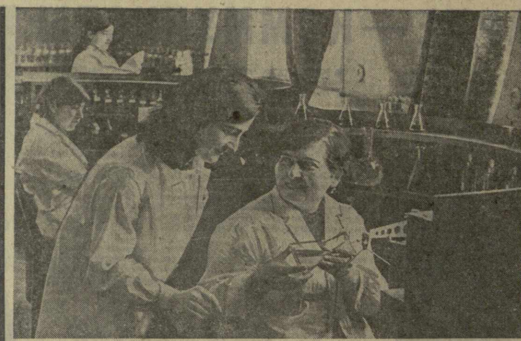
В ПАРФЮМЕРНО-КОСМЕТИЧЕСКОЙ ЛАБОРАТОРИИ Тбилисской парфюмерной фабрики «Иверия» проверяется изготовленная продукция и создаются новые образцы.