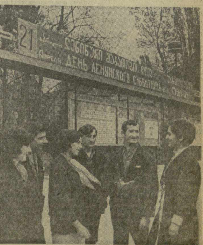
Коллектив тбилисского завода «ПЛАСТМАСС» единодушно решил принять активное участие во Всесоюзном ленинском субботнике. В фонд пятiletки будет перечислено около 2.000 рублей.

21 апреля коллектив тбилисского камвольно-суконного комбината «Советская Грузия» выпустит около тысячи метров ткани нового ассортимента, 2.000 рублей будет перечислено в фонд пятiletки. Состоит присвоение звания ударника коммунистического труда 100 молодым рабочим. Значительная часть продукции научно-производственного объединения «ЭЛВА» будет изготовлена на сэкономленном сырье и материалах. Тбилисский авторемонтный завод № 1 выпустит экспериментальный автопоезд для ташкентских строителей, сооружающих жилые корпуса в Гддан. Коллектив Сухумской ткацкой фабрики выпустит на 7.300 рублей продукции. 6 тысяч учащихся школ и профессионально-технических училищ г. Тбилиси займутся благоустройством города. 70 машинистов Тбилисского локомотивного депо поведут свои поезда на сэкономленной с начала года электроэнергии. Ахалдзские мебельщики перечислят 2.350 рублей в фонд пятiletки. С конвейера Цхинвальской швейной фабрики сойдет на 15 тысяч рублей различной продукции, 6 тысяч рублей будет перечислено в фонд девятой пятилетки. Горняки шахты имени Н. Лакоба угольного объединения «Тхарчели» обеспечат