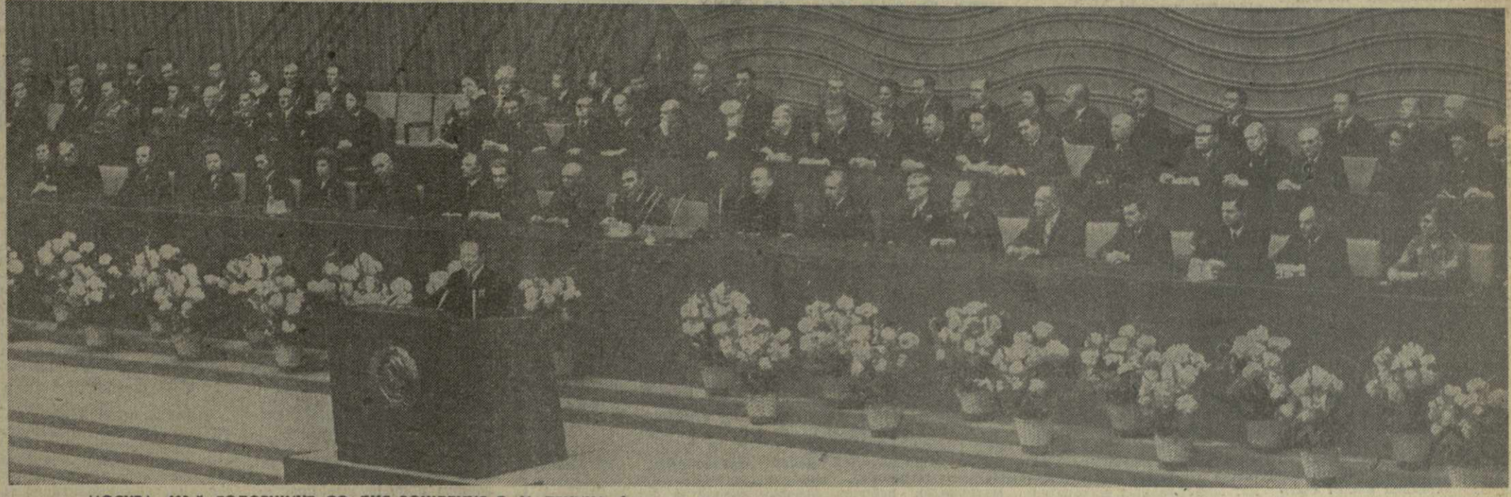
МОСКВА. 103-Я ГОДОВЩИНЕ СО ДНЯ РОЖДЕНИЯ В. И. ЛЕНИНА было посвящено торжественное заседание, которое состоялось 20 апреля в Кремлевском Дворце съездов. На снимке: в президиуме торжественного заседания. На трибуне — Д. Ф. Устинов. ТАСС. (Принято по фототелеграфу ГрузинФОРМА).

Затем состоялся праздничный концерт. (ТАСС)