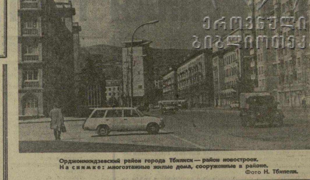
Орджоникидзевский район города Тбилиси — район новостроек. На снимке: многоэтажные жилые дома, сооруженные в районе.