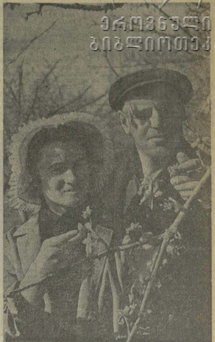
В садах Ереванского совхоза Цхинвальского района на 500 гектарах возделываются фрукты.

Производительность труда возросла на 4,8 процента. За счет повышения производительности труда получено около 80 процентов прироста промышленной продукции. Прибыль увеличилась на 9 процентов.