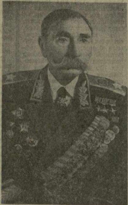
го фронта. И Деникин покинул назад на юг, к берегам Чёрного моря...

В ПЕРВЫЕ его имя я услышал в 1918 году, когда в стране запылало пламя гражданской войны. На Дону из станицы в станицу шла молва о сыне бедняка-крестьянина с хутора Козорина (под Ростовом) Семёне Буденном, собирающем беднейших казаков на борьбу против врагов Советской власти.