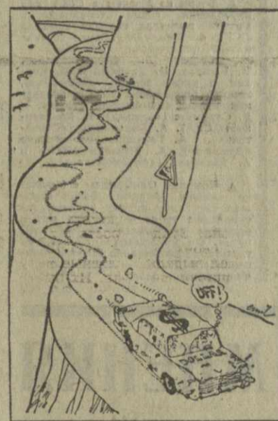
Карикатура из австрийской газеты «Кронен-цайтунг» изображает доллар США, катящийся по краю пропасти вниз.

Недавний валютно-финансовый кризис подорвал престиж американского доллара, как основной валюты капиталистического мира. За этим кризисом, несомненно, последуют новые — предостерегает финансовый эксперт Запада.