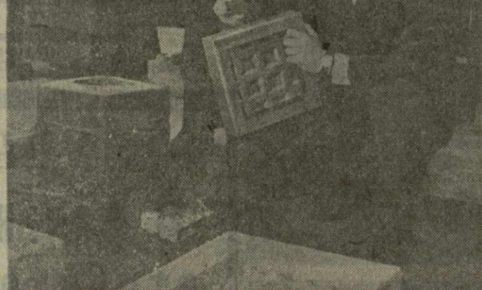
В ЛИТЕЙНОЙ ЛАБОРАТОРИИ ТБИЛИССКОГО ПРОЕКТНО-ТЕХНОЛОГИЧЕСКОГО НАУЧНО-ИССЛЕДОВАТЕЛЬНОГО ИНСТИТУТА МАШИНОСТРОЕНИЯ И ЭЛЕКТРОТЕХНИКИ (ПТИИИЭ) разработан новый способ производства заготовок методом литья в керамические формы.