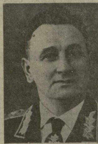
Член Политбюро ЦК КПСС А. А. ГРЕЧКО.