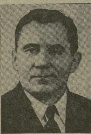
Член Политбюро ЦК КПСС А. А. ГРОМЫКО.