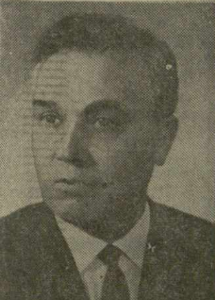
Кандидат в члены Политбюро ЦК КПСС Г. В. РОМАНОВ.