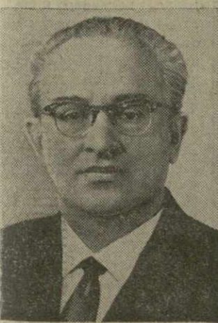
Член Политбюро ЦК КПСС Ю. В. АНДРОПОВ.

Первомайский, имени 26 комиссаров и Октябрьский райкомы г. Тбилиси и Гардабанский РК КП Грузии, республиканские комитеты профсоюзных рабочих пищевой, текстильной и легкой промышленности недостаточно занимаются вопросами деятельности этих предприятий, не оказывают необходимую помощь партийным и профсоюзным организациям в укреплении государственной и трудовой дисциплины. Гардабанский и Октябрьский райкомы партии за последние годы, по существу, не рассматривали вопрос работы меховой фабрики и хозрасчетного участка.