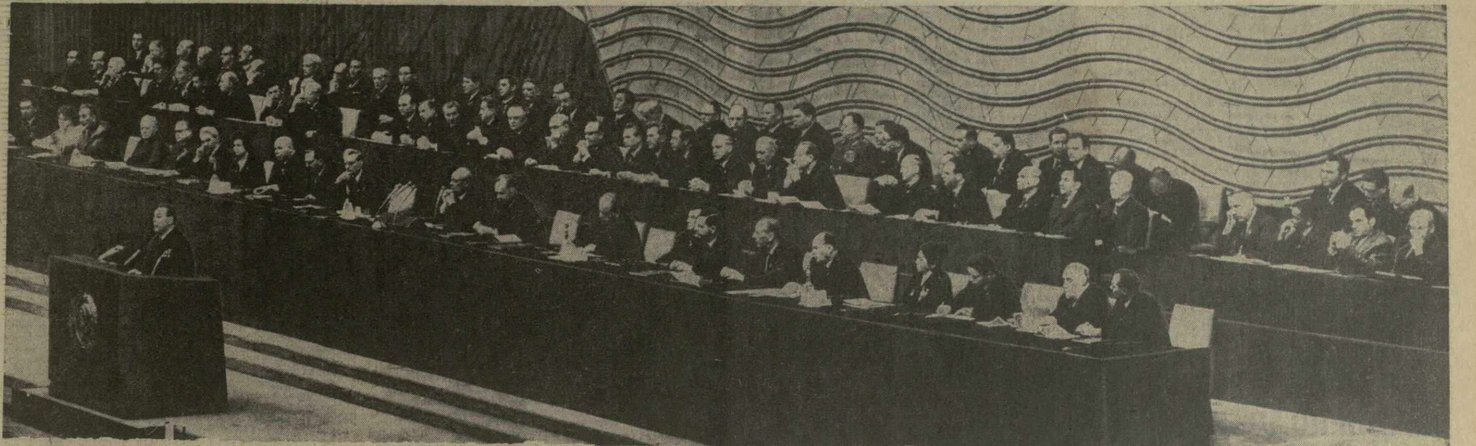
МОСКВА. Открытие XXIV съезда КПСС. На снимке: в Президиуме съезда.

С отчетным докладом Центрального Комитета КПСС выступил Генеральный секретарь ЦК КПСС тов. БРЕЖНЕВ Л. И., горячо встреченный делегатами и гостями съезда.