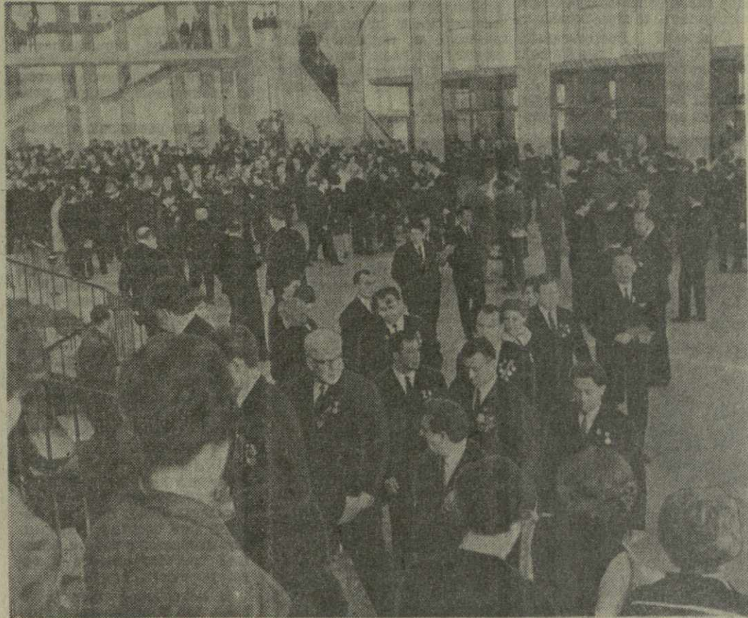
Москва. XXIV съезд КПСС. На снимке: в Кремлевском Дворце съездов.

ним будущим, ибо ваш нынешний день — это наш завтрашний день.