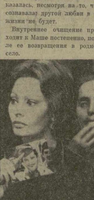
На снимке: кадр из кинофильма «Подсолнухи».