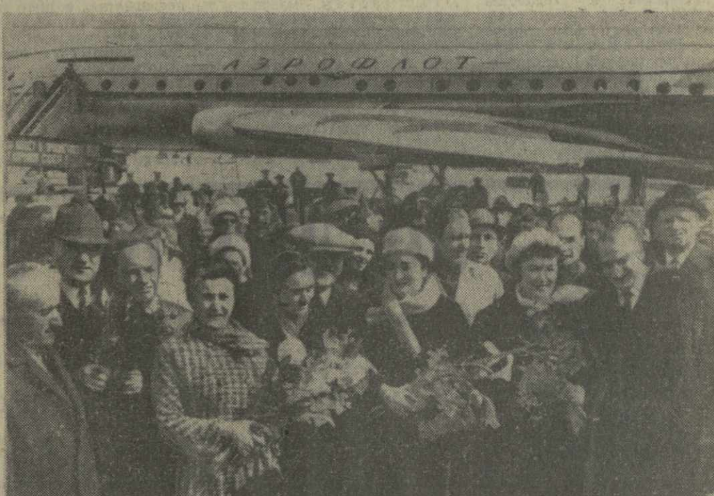
МОСКВА, 18 апреля 1971 года. Делегация Грузинской ССР на Внуковском аэродроме. Фото И. Двали, Г. Киквадзе. (Принято по фототелеграфу ГрузТАГа).