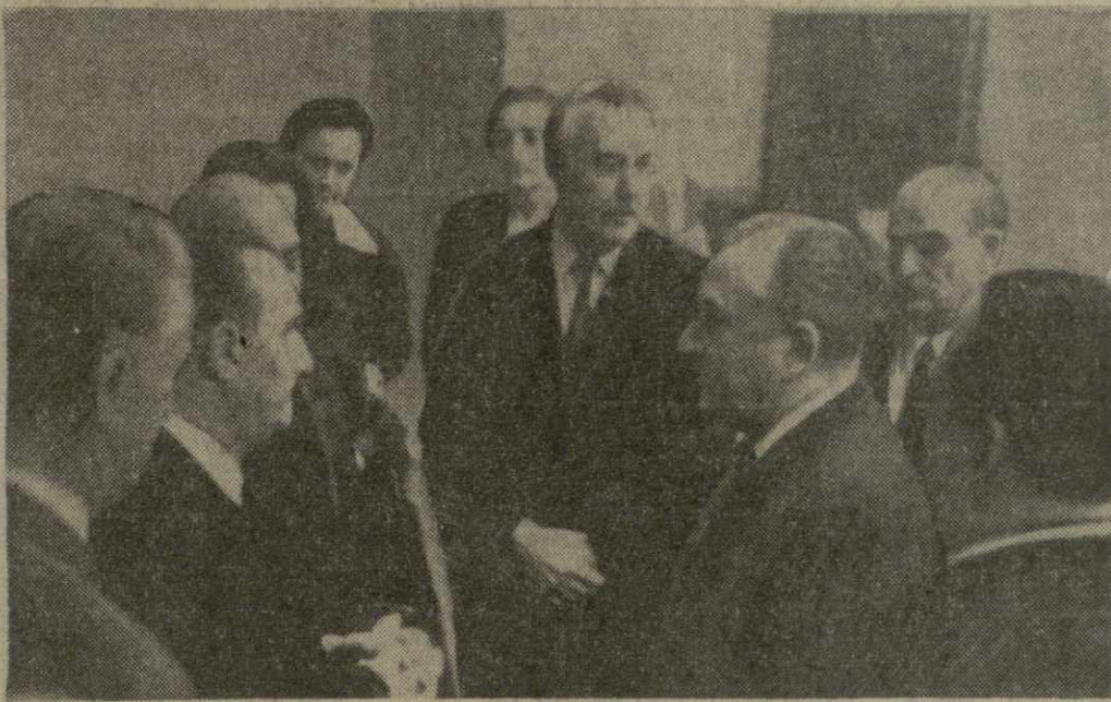
МОСКВА, 19 апреля 1971 года. В Московском городском комитете КПСС состоялся прием в честь делегации Грузинской ССР. Представителей солнечной Грузии принял член Политбюро ЦК КПСС, первый секретарь МКГ В. В. Гришин. На снимке: прием в Московском городском комитете КПСС.