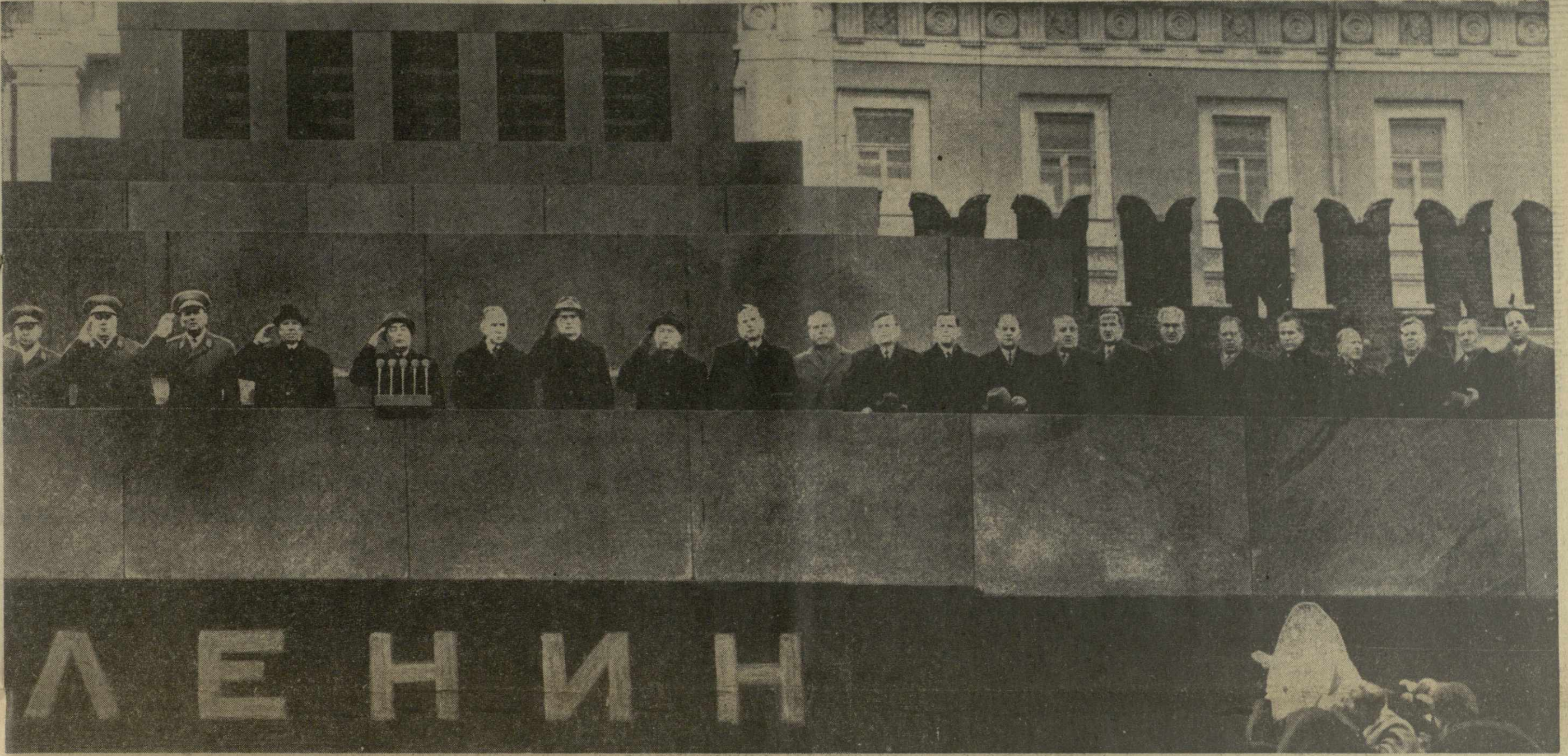
Празднование 1 Мая 1971 года в Москве. Торжественный митинг представителей трудящихся на Красной площади.

В колоннах праздничных шествий трудящиеся нашей великой Родины продемонстрировали свою верность Коммунистической партии, делу пролетарского интернационализма.