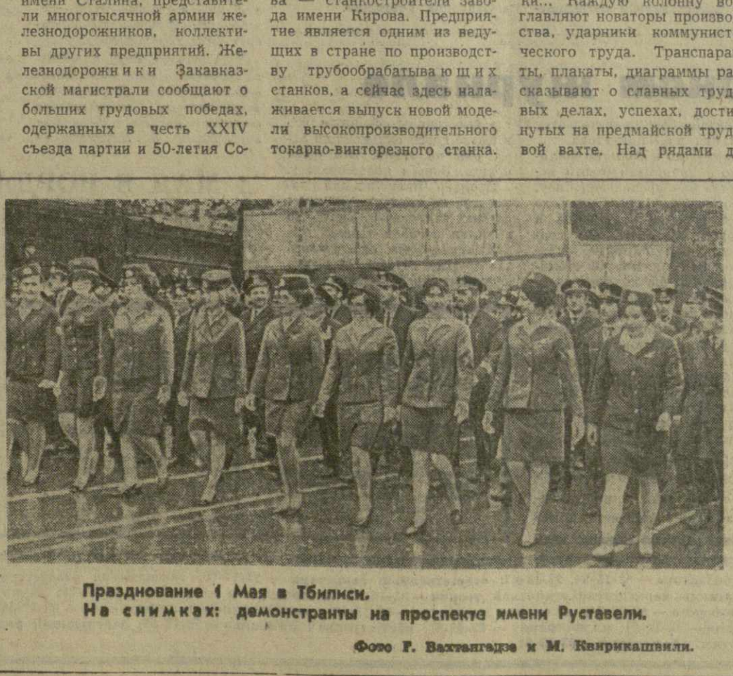
Празднование Первомай в Тбилиси. На снимке: колонна демонстрантов.