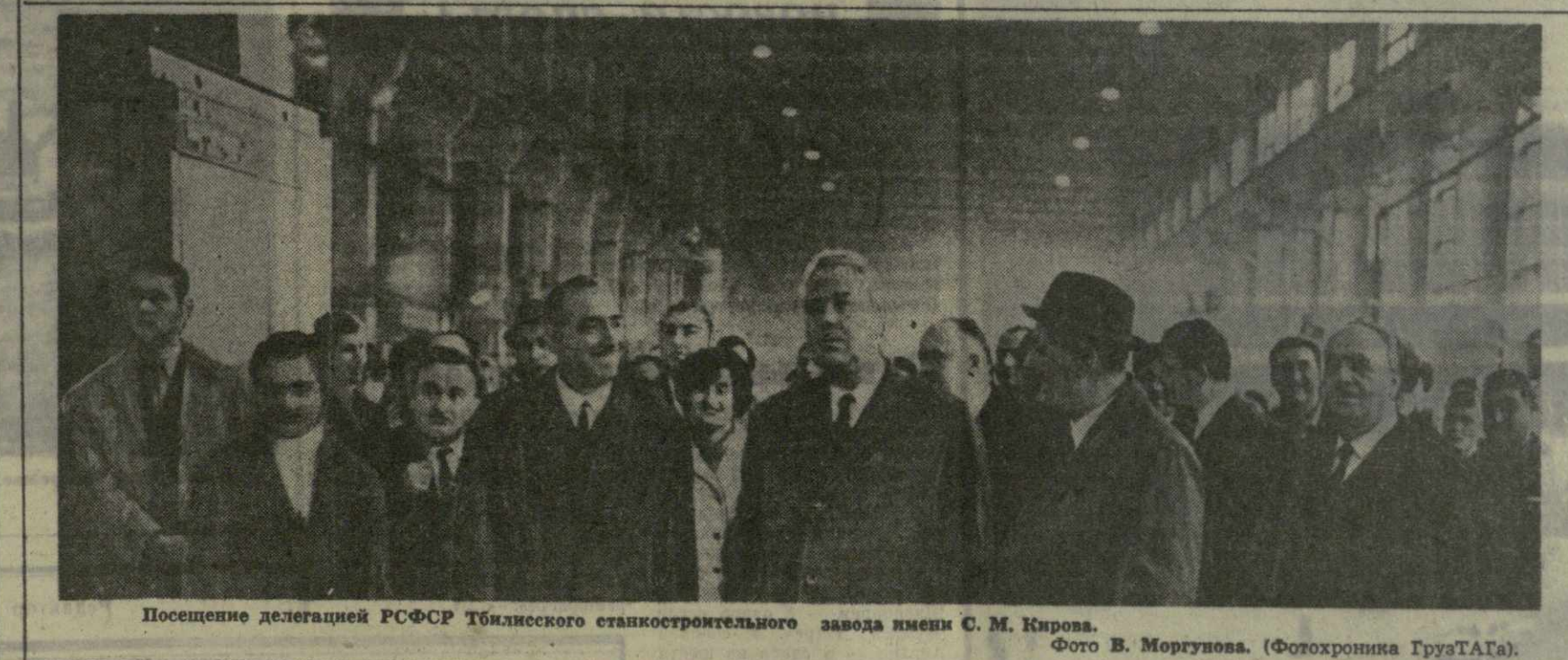
Посещение делегацией РСФСР Тбилисского станкостроительного завода имени С. М. Кирова. Фото В. Моргунова. (Фотохроника ГрузТАГ).

Г. В. Романов преподнес коллектив и в академии барельеф В. И. Ленина, выполненный ленинградскими мастерами. (ГрузТАГ).