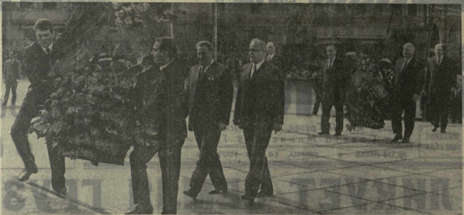
На снимке: возложение цветов к памятнику В. И. Ленину.

Товарищ Л. И. Брежнев, руководители Грузинской ССР, делегации городов-героев Москвы, Ленинграда, союзных республик минутой молчания почтили память основателя Коммунистической партии, создателя первого в мире социалистического государства В. И. Ленина.