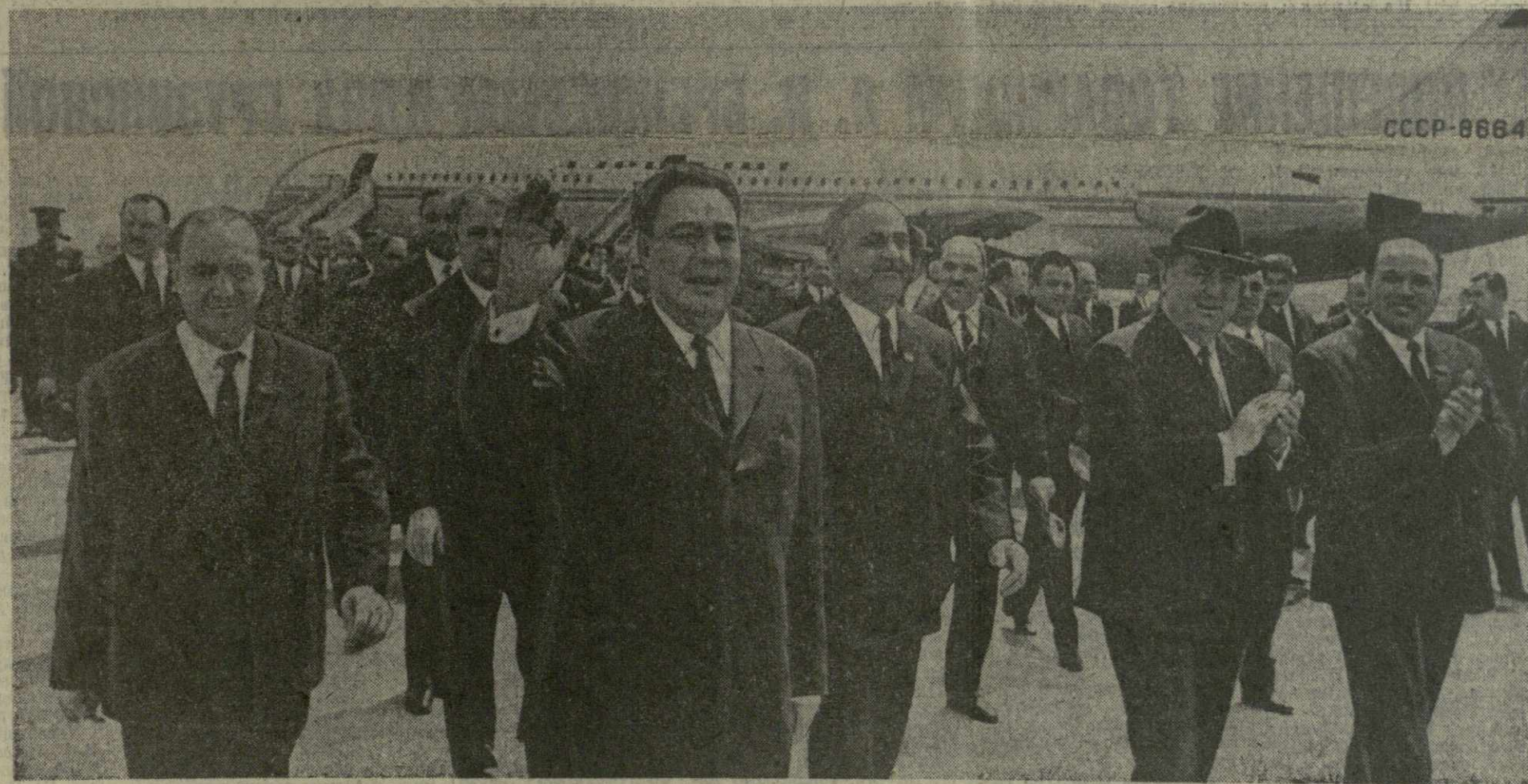
Тбилиси, 13 мая 1971 г. На снимке: встреча Генерального секретаря ЦК КПСС товарища Л. И. Брежнева в Тбилисском аэропорту.