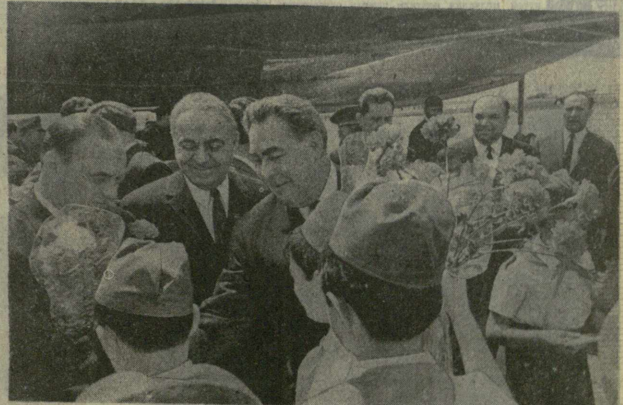
Тбилиси, 13 мая 1971 г. На снимке: тбилисские пионеры преподносят букеты цветов Генеральному секретарю ЦК КПСС товарищу Л. И. Брежневу. Слева — кандидат в члены Политбюро ЦК КПСС, первый секретарь ЦК КП Грузии товарищ В. П. Мжланадзе.

Успехи грузинского народа за прошедшие полвека, одержанные в нерушимой братской семье советских народов, — яркое свидетельство силы и жизнеспособности ленинской национальной политики Коммунистической партии, дружбы и взаимопомощи советских народов. Встреча Леонида Ильича Брежнева, прибывшего на юбилейные торжества, вылилась в волнующую манифестацию единения и сплоченности грузинского народа вокруг Коммунистической партии и Советского правительства, продемонстрировала его готовность внести свой вклад в осуществление грандиозной программы дальнейшего подъема нашей страны, намеченного XXIV съездом Коммунистической партии Советского Союза. На флагштоках развеваются государственные флаги Советского Союза, Грузинской ССР, всех союзных республик. Повсюду видна цифра «50». На фасадах зданий — портреты К. Маркса, Ф. Энгельса, В. И. Ленина, членов Политбюро Центрального Комитета КПСС. На красных пологоничах, протянутых вдоль улиц и площадей, начертаны горячие, идущие от всего гостеприимного грузинского сердца слова: «Нетили иностявени мობრძანება!», «Добро пожаловать, дорогой Леонид Ильич!», «Слава КПСС!», «Да здравствует нерушимая ленинская дружба народов Советского Союза!».