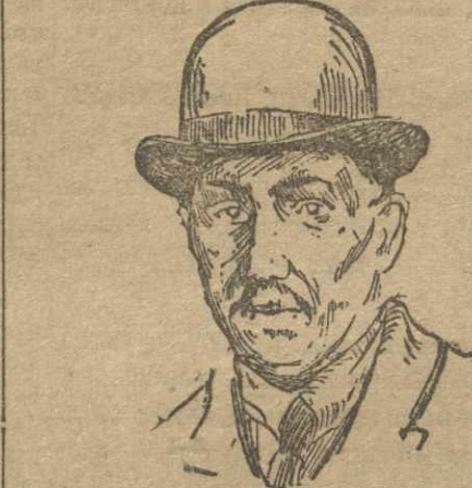
ТОМАС, ДЖЕМС ГЕНРИ.

Один из крайних правых вождей английской рабочей партии и II Интернационала; был министром колоний в кабинете Макдональда; на этом посту прославился историческими расправами с рабочим движением в Индии и Египте.