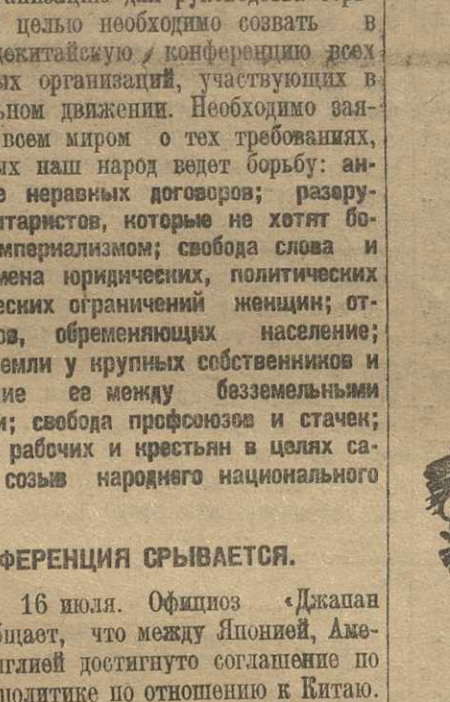
ВЕЛИНГТОН-У. Министр иностранных дел Китая...