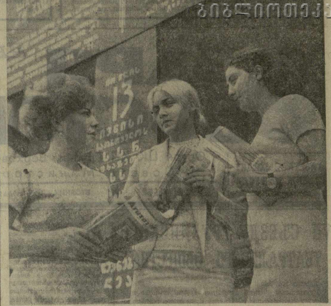
Алмы полотношцами украшен фасад Сухумского Дома культуры...