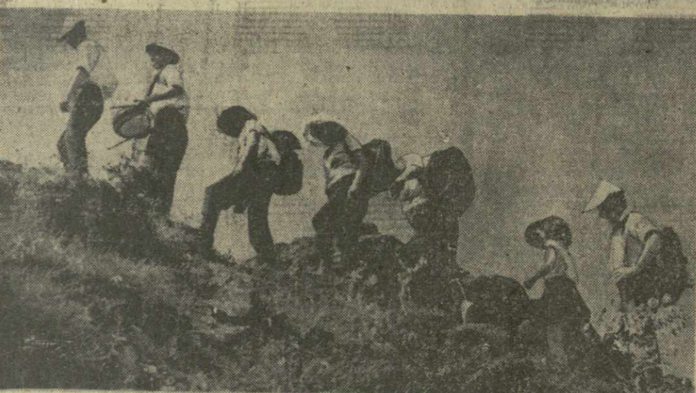
Пройдет еще совсем немного времени, прозвонит последний звонок, и наступит пионерское лето. Звонко, весело, солнечно. А это значит — настанет пора загородных путешествий, прогулок, интересных походов.