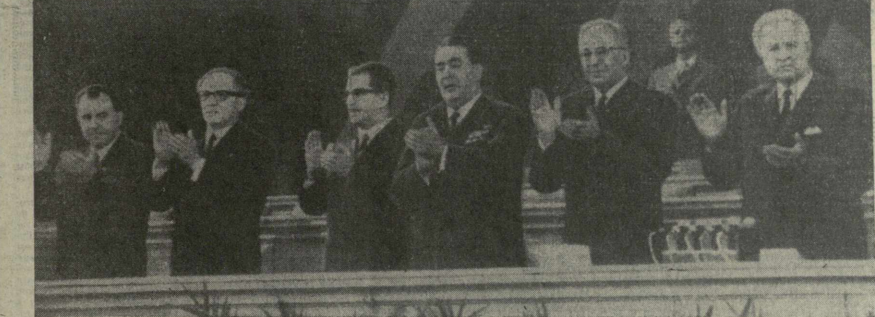
В президиуме съезда.