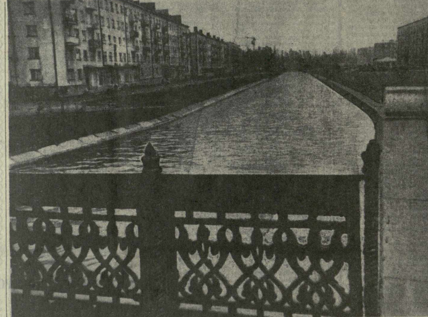
ПОТИ. Один из уголков города.

Ответный матч между молодежными сборными СССР и Испании состоится 27 октября в нашей стране.