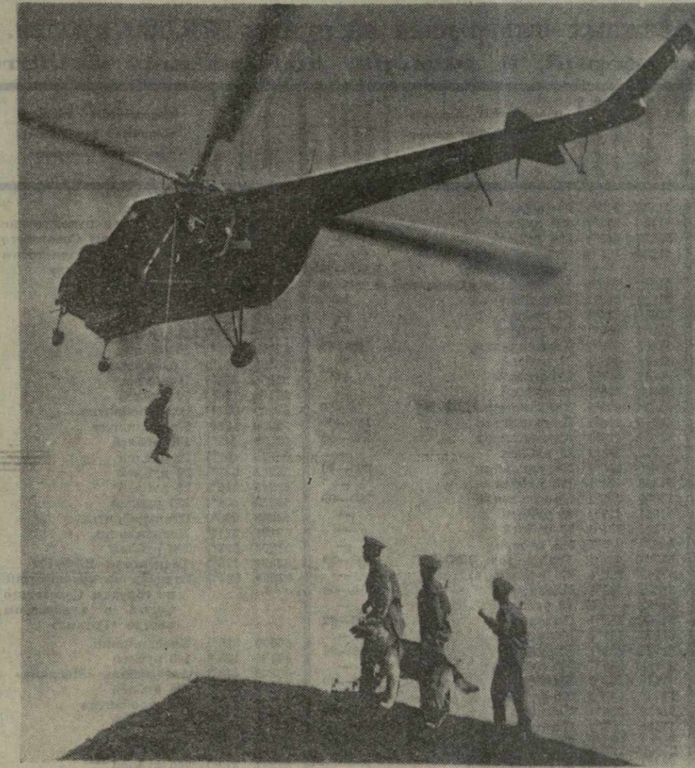
Для усиления дежурного наряда достаточно вызвать по радию вертолет, с которого в любой местности спускают пограничников.