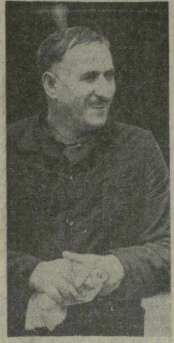
Коллектив Тбилисского электровозостроительного завода имени Ленина обязался досрочно завершить задания первого года девятой пятилетки и выпустить сверх плана один электровоз.

химико-фармацевтического, «Тбилирибор», «Магнитофон», «Пластмасс», электровозостроительного имени Ленина, автостроительного имени Орджоникидзе, авторемонтных № 1 и № 2, механических № 1 и № 4, винных № 1 и № 3, коньячного; комбинатов — прядильно-трикотажного и камвольного-суконного «Советская Грузия», молочного; фабрик — табачных № 1 и № 2, чаеразвешивочной, швейных № 1 и № 6; Тбилистпрополитена, Тбилисского отделения Закавказской железной дороги, авиационного транспорта, автотранспортных предприятий № 1 и № 5 и др.