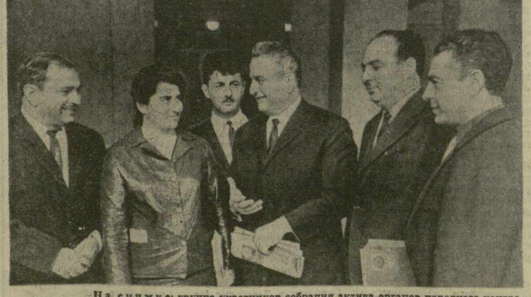
На снимке: группа участников собрания актива органов народного контроля республики.

3 июня в помещении Грузинского филиала Института марксизма-ленинизма при ЦК КПСС состоялось собрание актива органов народного контроля Грузинской ССР, посвященное задачам органов народного контроля республики в деле претворения в жизнь решений XXIV съезда КПСС.