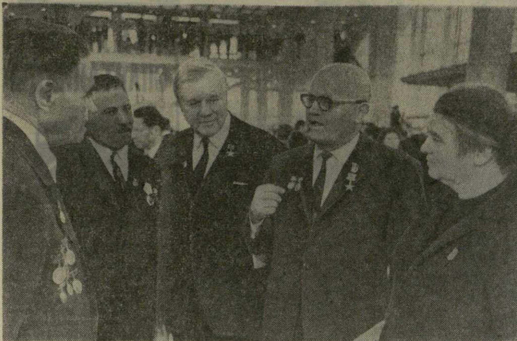
Этот снимок сделан в Москве в дни работы XXIV съезда КПСС...