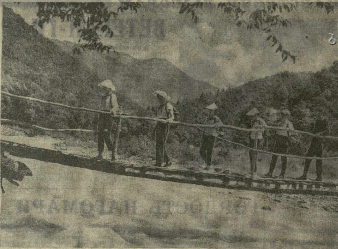
На снимке: в туристском походе.

Туризм заслуживает самого серьезного внимания. Для того, чтобы он стал подлинной индустрией отдыха, партийные, советские, профсоюзные и комсомольские организации должны оказать любителям путешествий всестороннюю помощь и поддержку.