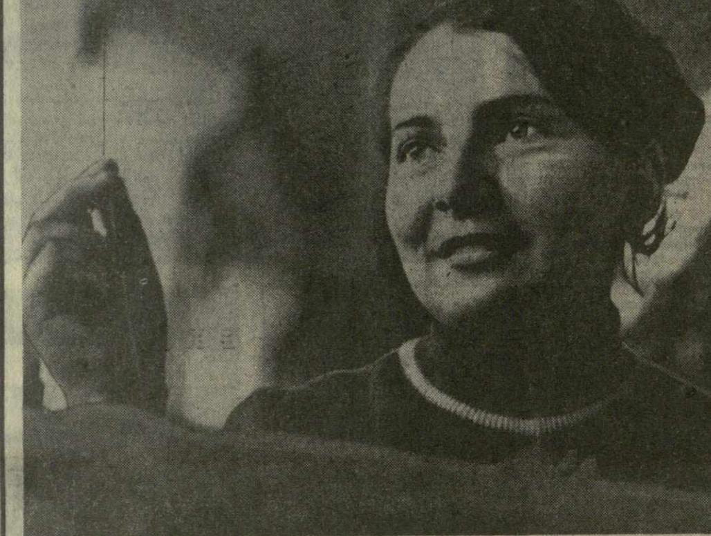
Коллектив Чиатурской швейной фабрики № 14 успешно борется за досрочное выполнение заданий первого года девятилетки.

Польская выставка 14 июня в Тбилиси открылась выставка польских крашителей. Она организована внешнеторговым объединением по импорту и экспорту химикатов «ЦИОХ» при содействии Всесоюзной и Грузинской торговых палат.