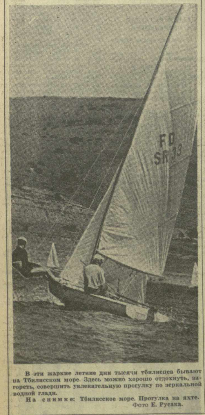
В эти жаркие летние дни тысячи тбилисцев бьются на Тбилисском море. Здесь можно хорошо отдохнуть, заглотить, совершить увлекательную прогулку по зеркальной водной глади. На снимке: Тбилисское море. Прогулка на яхте.