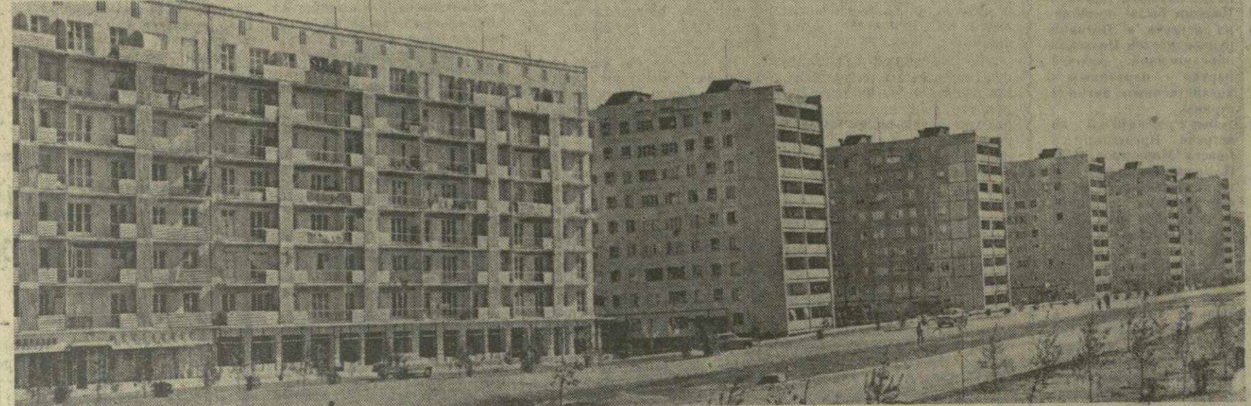
Год от года растет и хорошеет город Густаи. За последние время здесь построены многоэтажные жилые дома для металлургов и рабочих химического комбината, школы и детские ясли, кинотеатр, магазины, комбинаты бытового обслуживания и другие здания. На снимке: новые жилые дома на проспекте Дружбы.