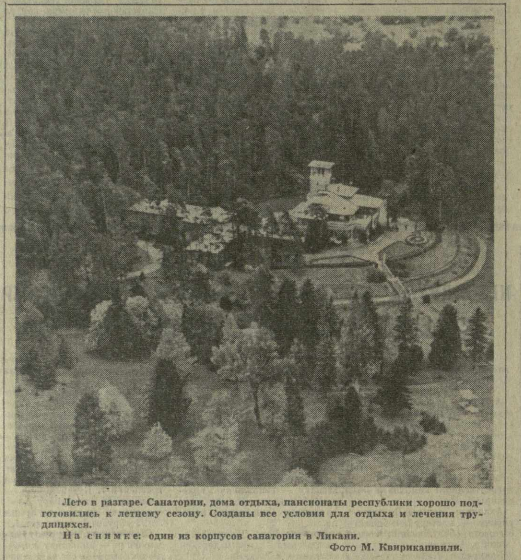
Лето в разгаре. Санатории, дома отдыха, пансионаты республики хорошо подготовлены к летнему сезону. Созданы все условия для отдыха и лечения трудящихся. На снимке: один из корпусов санатория в Ликави.

Из Демократической Республики Вьетнам в Тбилиси возвратилась группа проектировщиков института «Грузгипрошпротром». Грузинские специалисты оказали вьетнамским друзьям помощь в разработке рабочих чертежей чайной фабрики, строительство которой началось в провинции Эн-Бай. Также же фабрики, мощностью 13,5 тонны зеленого чайного листа в сутки, намечено построить и в ряде других провинций Вьетнама. По проекту наших специалистов началось и строительство чайной фабрики в провинции Нга-Ло. Она будет перерабатывать 42 тонны чайного листа в сутки. Все технологическое оборудование для чайных фабрик ДРВ изготовлено в Советском Союзе. Для подготовки обслуживающего персонала в Грузию прибыла группа вьетнамских друзей, которая пройдет практику на чайных фабриках республики. Совместная, дружеская работа грузинских и вьетнамских специалистов позволит увеличить производство чая в ДРВ. А. ЧЕДИЯ.