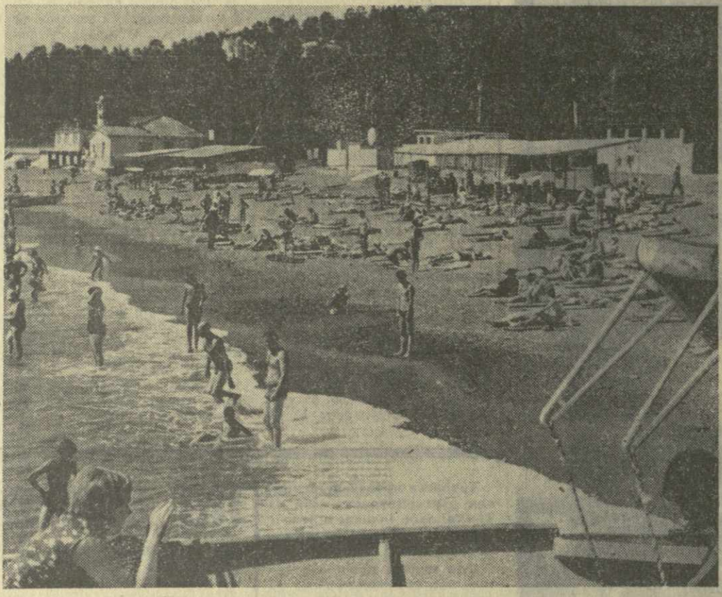
На Черноморском побережье Абхазии в разгаре летний курортный сезон. Фотокорреспондент ГрузТАГА И. Чохонелдзе сделал этот снимок на одной из пляжей города Сухуми.