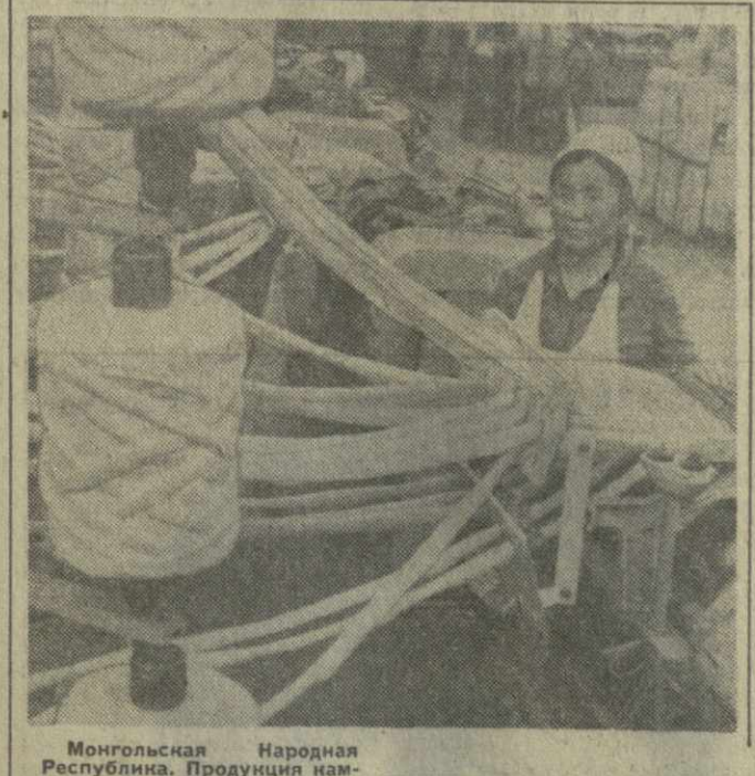
Монгольская Народная Республика. Продукция комбината Улан-Баторского промкомбината пользуется большим спросом в республике и экспортируется в десять стран. На снимке: в прядильном цехе фабрики.

дил применение чрезвычайных законов против бастующих, вмешательство израильских властей в трудовые конфликты, зверские расправы полиции с бастующими рабочими и служащими. В резолюции пленума резкой критике подвергается руководство Гитадарта (профессиональные союзы), давшее согласие на применение чрезвычайных законов. Пленум призвал всех трудящихся Израиля сорвать принятие правительством законов, запрещающих забастовки. ЦК КПИ выразил протест в связи с полицейским произволом израильских властей, которые запрещают членам ЦК КПИ свободно передвигаться по стране, в результате чего многие из них не смогли принять участие в работе пленума.