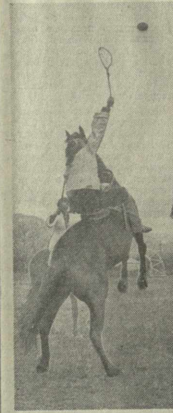
На снимке: цхенбурти — игра смелых и мужественных.