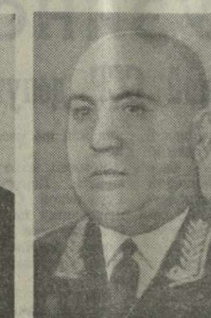
А. Н. ИНАУРИ, председатель Комитета государственной безопас- ности при Совете Министров Грузинской ССР.