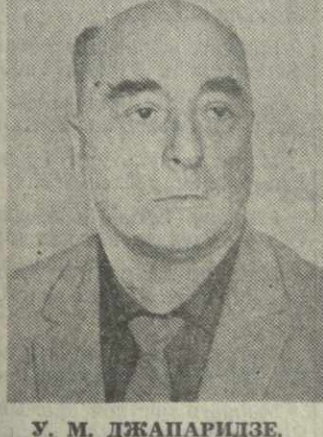
У. М. ДЖАПАРИДЗЕ, член Президиума Верховного Совета Грузинской ССР.