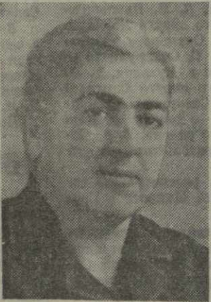
Ф. Д. ДУМБАДЗЕ, министр бытового обслуживания населения Грузинской ССР.