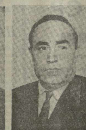
К. К. ГАРДАВХАДЗЕ, председатель Государственного комитета Совета Министров Грузинской ССР по телевидению и радиовещанию.