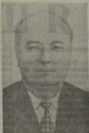
Г. Д. ДЖАВАХИШВИЛИ, Председатель Совета Министров Грузинской ССР.