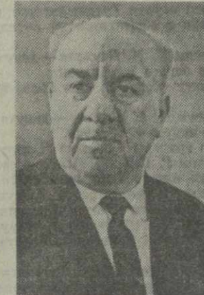
М. Б. НАРСИЯ, министр заготовок Грузинской ССР.