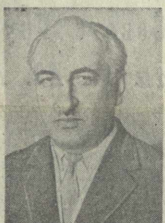
Б. В. ШИНКУБА, заместитель Председателя Президиума Верховного Совета Грузинской ССР.