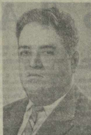
Е. М. ДЖАПАРИДЗЕ, заместитель Председателя Совета Министров Грузинской ССР, председатель Государственного плана и комитета Совета Министров Грузинской ССР.