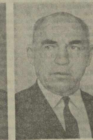
К. С. ЧИКАУРИДЗЕ, председатель Государст- венного комитета цен Совета Министров Грузинской ССР.