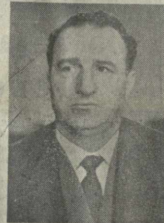
Г. С. ДЗЮЕНИДЗЕ, Председатель Президиума Верховного Совета Грузинской ССР.