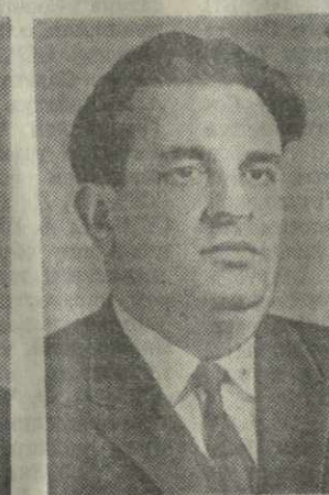
Г. А. ДУЧИДЗЕ, министр мясной и молочной промышленно- сти Грузинской ССР.