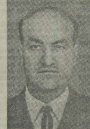
В. Г. ВОЧОРИШВИЛИ, министр здравоохранения Грузинской ССР.