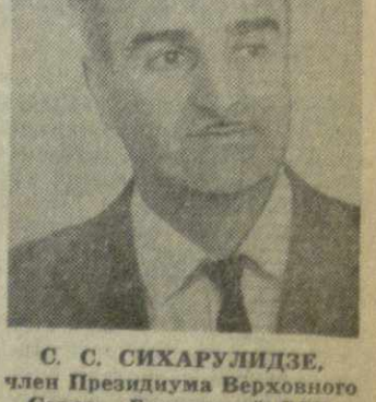
С. С. СИХАРУЛИДЗЕ, член Президиума Верховного Совета Грузинской ССР.