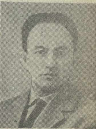
З. Н. ГАССИЕВ, член Президиума Верховного Совета Грузинской ССР.