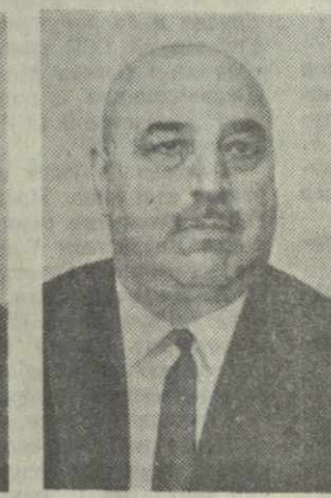
С. С. ЛОРТКИПАНИДЗЕ, министр промышленности строительных материалов Грузинской ССР.