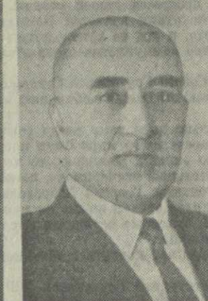
В. А. ПААТАШВИЛИ, министр коммунального хозяйства Грузинской ССР.