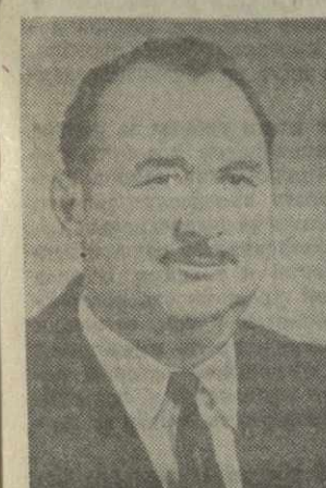
И. А. ХАРТИШВИЛИ, министр сельского строительства Грузинской ССР.