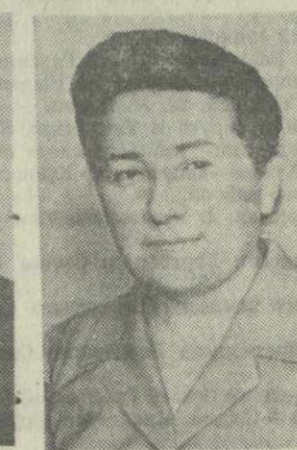
Т. В. ЛАШКАРАШВИЛИ, министр просвещения Грузинской ССР.