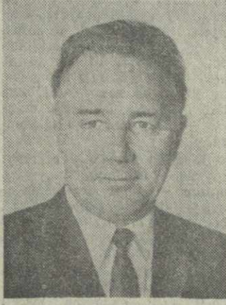
Б. З. БАРСУКОВ, член Президиума Верховного Совета Грузинской ССР.