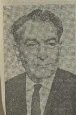
М. Ф. ЧХЕИДЗЕ, министр легкой промышленности Грузинской ССР.