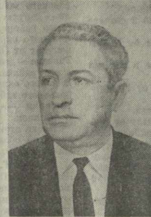
Г. Н. ДЖИВЛАДЗЕ, министр высшего и среднего специального образования Грузинской ССР.