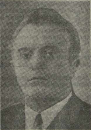
З. А. ШЕВАРДНАДЗЕ, министр внутренних дел Грузинской ССР.