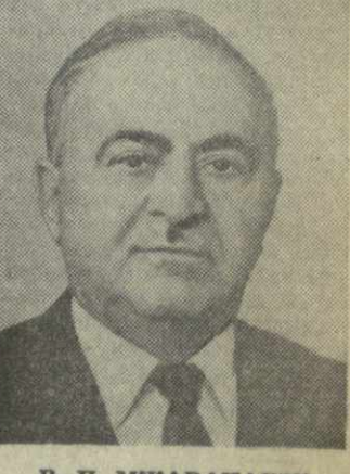
В. П. МЖАВАНАДЗЕ, член Президиума Верховного Совета Грузинской ССР.