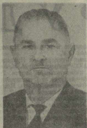
Ш. Д. КИКНАДЗЕ, первый заместитель Председателя Совета Министров Грузинской ССР и министр иностранных дел Грузинской ССР.