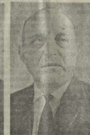
Г. С. ВАШАКИДЗЕ, министр строительства Грузинской ССР.