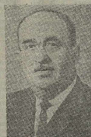
Г. С. КОБУЛИЯ, министр мелиорации и водного хозяйства Грузинской ССР.