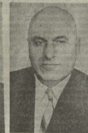
М. Е. ТОНУРИДЗЕ, министр социального обеспечения Грузинской ССР.