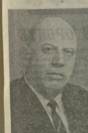
В. С. КВАРАЦХЕЛИЯ, председатель Комитета народного контроля Грузинской ССР.