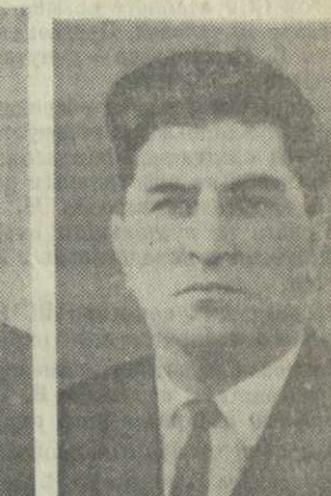
И. Н. ЦИНИШВИЛИ, председатель Государственного комитета Совета Министров Грузинской ССР по делам строительства.