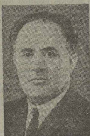
Ш. А. ДОЛИДЗЕ, министр лесной и дерево- обрабатывающей промышленности Грузинской ССР.