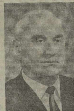
И. Г. РТВЕЛИШВИЛИ, министр сельского хозяйства Грузинской ССР.