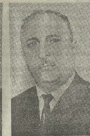
В. З. ТОХАДЗЕ, министр торговли Грузинской ССР.