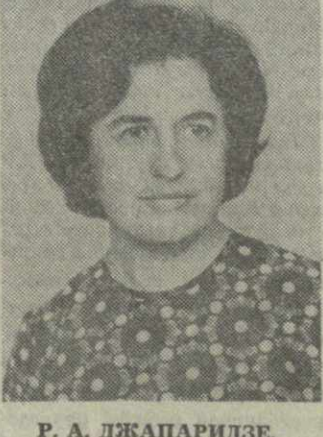
Р. А. ДЖАПАРИДЗЕ, член Президиума Верховного Совета Грузинской ССР.