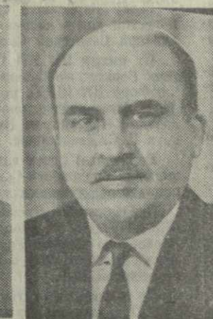
А. В. ЧИРАКАДЗЕ, министр финансов Грузинской ССР.