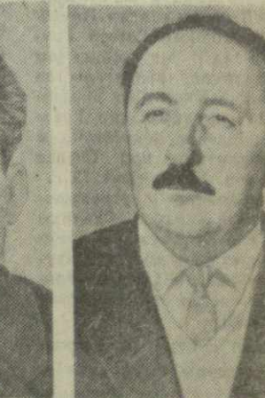
Л. М. ДАВИТАДЗЕ, Председатель Совета Министров Аджарской АССР.