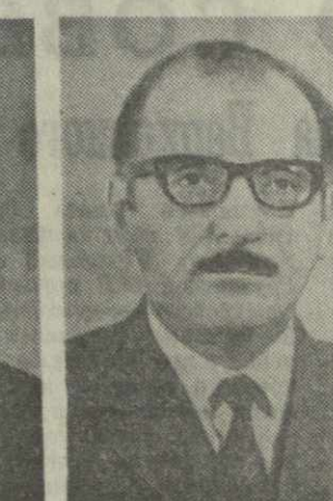
Г. И. ХУЧИШВИЛИ, председатель Государственного комите- та Совета Министров Гру- зинской ССР по печати.