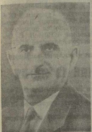
Г. В. РОБИТАШВИЛИ, министр автомобильных дорог Грузинской ССР.