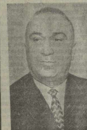
М. Б. ГВИНДИЛИЯ, министр совхозов Грузинской ССР.