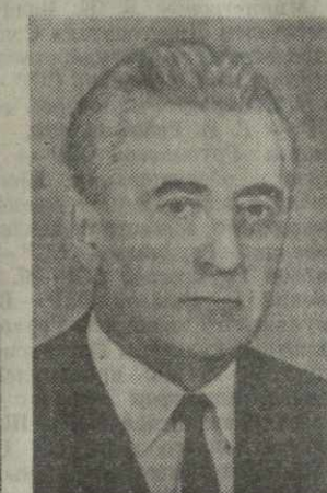
В. А. ЧОПИКАШВИЛИ, министр местной промышленности Грузинской ССР.