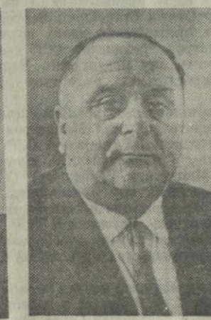
А. В. ХУРОДЗЕ, министр пищевой промышленности Грузинской ССР.