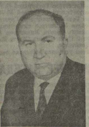
Т. Н. ДАВИТАШВИЛИ, министр автомобильного транспорта Грузинской ССР.