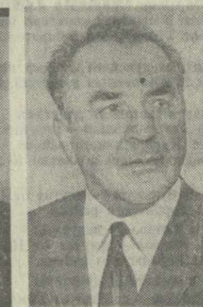
В. И. МАЙСУРАДЗЕ, министр юстиции Грузинской ССР.