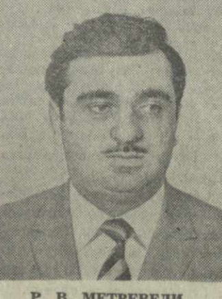
Р. В. МЕТРЕВЕЛИ, член Президиума Верховного Совета Грузинской ССР.