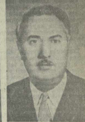
О. В. ТАКТАКИШВИЛИ, министр культуры Грузинской ССР.