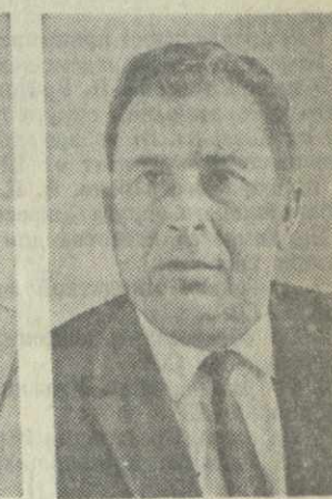
К. И. КAVTAPADZE, министр связи Грузинской ССР.