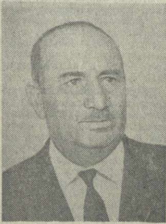
А. Г. БАТИАШВИЛИ, член Президиума Верховного Совета Грузинской ССР.