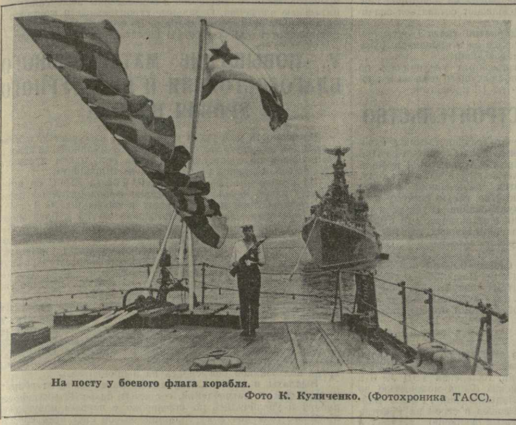
На посту у боевого флага корабля.