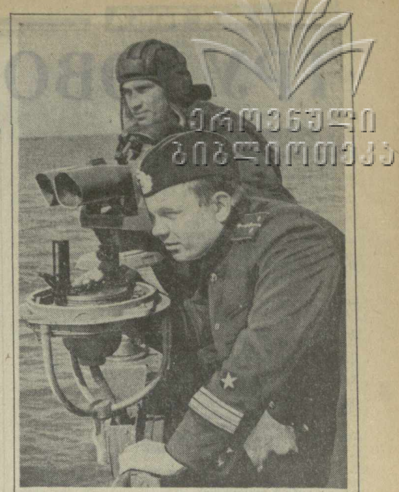
Необъятны просторы нашей Родины. Зорко стерегут ее морские рубежи моряки. Восторженной подготовкой, отличным знанием боевой и специальной техники помогают им отлично нести службу. На снимке: на охране морской границы.

СЕГОДНЯ — ДЕНЬ ВОЕННО-МОРСКОГО ФЛОТА СССР