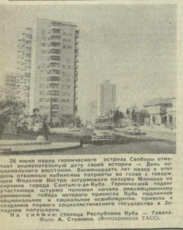
26 июля народ героического острова Свободы отмечает знаменательную дату своей истории — День национального восстания. Восемнадцать лет назад в этот день отважные кубинские патриоты во главе с товарищем Фиделем Кастро штурмовали назарму Монха на острове города Сантьяго-де-Куба. Героический подвиг участников штурма положило начало революционному движению, победа которого принесла Кубе подлинное национальное и социальное освобождение, привела к созданию первого социалистического государства в Западном полушарии. На снимке: столица Республики Куба — Гавана.

«развивались в лучшую сторону». Как положительный факт В. Брандт отметил расширение экономических и научно-технических связей между Советским Союзом и ФРГ.