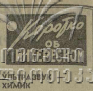
АМБЕ удивительные операции могут выполнять ультразвуковые установки в химическом производстве. В этом убеждают устройства, созданные во Всесоюзном научно-исследовательском и конструкторском институте химического машиностроения.

Наши войска разгромили окруженную группировку немцев. Венгерские города Эстергом и Тата были освобождены.