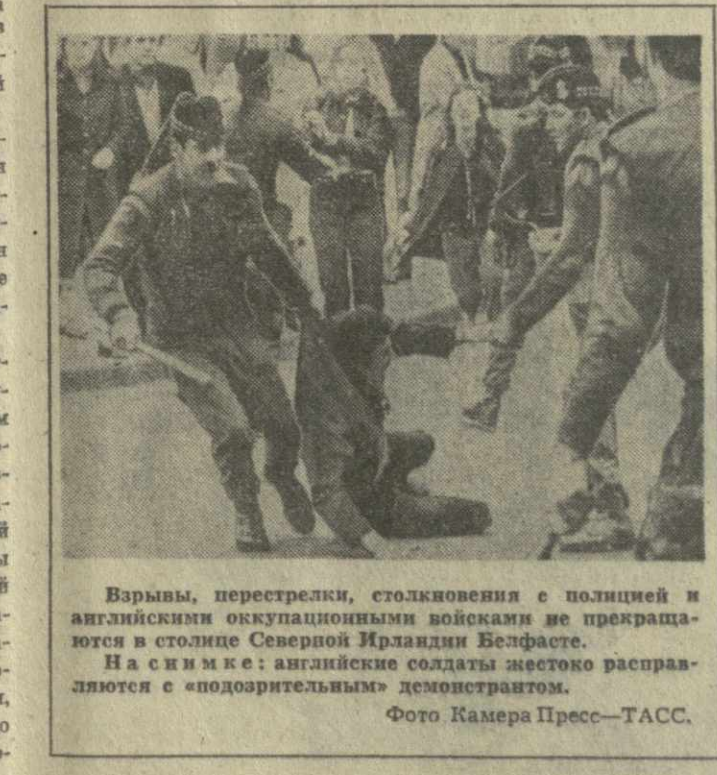
Варьяны, перестрелки, столкновения с полицией и английскими оккупационными войсками не прекращаются в столице Северной Ирландии Белфасте. На сцене: английские солдаты жестоко расправляются с «подозрительными» демонстрантами.

«суданское правительство во главе с Нимейри вновь взяло под контроль». Как сообщает радио Омдурмана, генерал Нимейри, со своей стороны, направил посылку Мао Цзе-дуну, в которой выразил уверенность в том, что «иревоскодные отношения, связывающие правительство двух стран, будут укрепляться и вперед, благодаря взаимопониманию и сотрудничеству». (ТАСС, 30 июля).